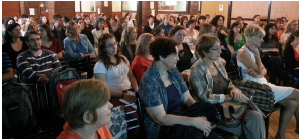
Asistentes y expositores