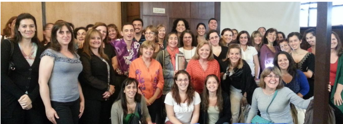
Miembros del Comité Académico, expositores y algunos asistentes.