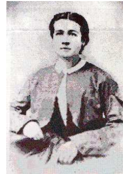
Fig. 2: Lucy Beaman Hobbs Taylor fue la primera mujer graduada en Odontología en el mundo. En 1866 obtuvo su diploma universitario en Cincinnati (EE.UU), en la Ohio College of Dental Surgery .