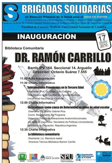
Fig. 2: Afiche de la inauguración de la primera biblioteca comunitaria con orientación en salud (BiCOS) Dr. Ramón Carrillo

Crear bibliotecas no es el problema, sino mantenerlas dentro de una realidad latinoamericana de constantes cambios socio-políticos. A partir de aquí surge el proyecto del voluntariado, en dónde con un diagnóstico previo, se pudieron detectar muchos puntos de conflicto, entre ellos: