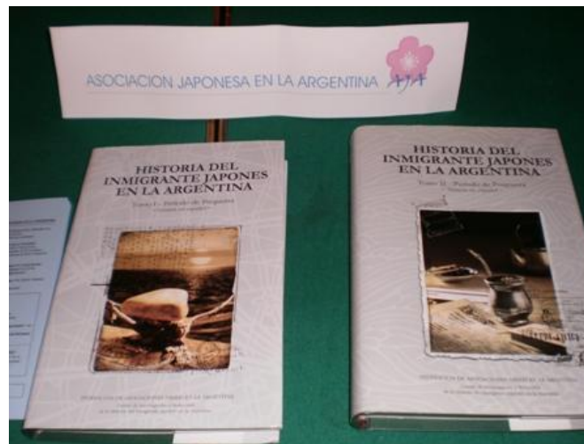
Foto 5: Material del stand de la Asociación Japonesa Argentina (AJA)