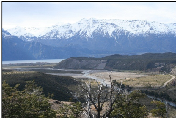
Figura 2. Al fondo, Fachinal, planicie lacustre. Derecha Ruta X-265 y Río Avilés.

En las siguientes páginas se describen algunas de las características constitutivas del grupo humano que queda en Fachinal y su interrelación con los recursos naturales para el desarrollo y sustento de su modo de vida, considerando su historia, sus relaciones económicas y manifestaciones culturales compartidas dentro de los espacios territoriales en común.