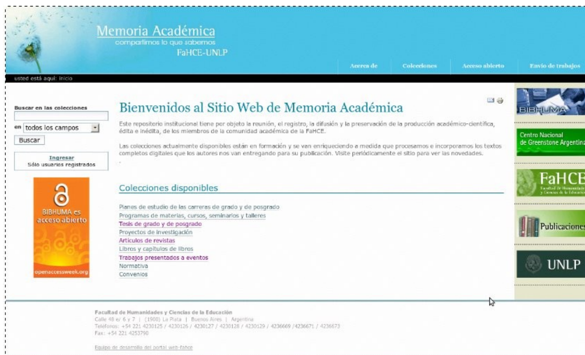
Figura 1: Página de inicio MA-FaHCE-UNLP (15-8-2010)

El proyecto fue aprobado en el año 2006 por el Honorable Consejo Académico de la FaHCE ( Res. Nro. 188/2006 ), dándose inicio a las labores necesarias para su construcción. Durante 2007 se elaboraron, discutieron y aprobaron las pautas para la conformación del repositorio ( Res. Nro. 210/2007 ), que se puso en funcionamiento ese mismo año. La iniciativa fue liderada por la Biblioteca de la Facultad -Bibhuma-, que quedó a cargo de la tarea, la cual se realiza en conjunto con el resto de las áreas involucradas en la generación y gestión de los documentos a incluir.