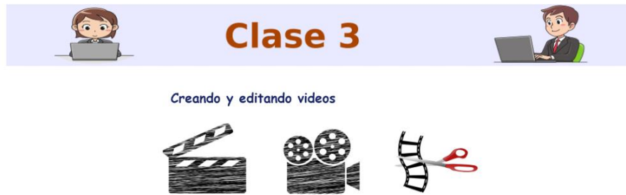
FIGURA 4. Parte de la portada de la clase 3, correspondiente a la unidad #2.