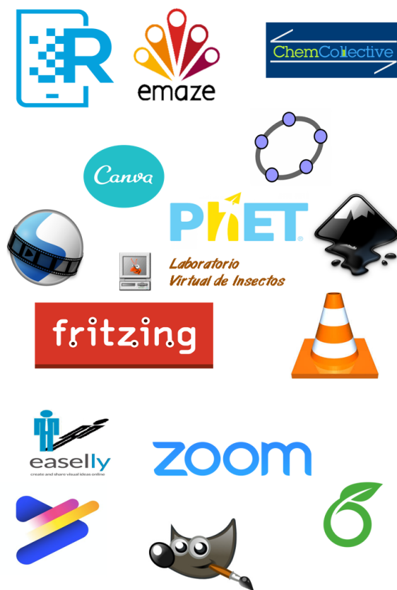
FIGURA 3. Algunas de las herramientas digitales de la propuesta de curso.

En lo que respecta a la evaluación de la propuesta de curso, es de una ponderación de 0 a 100, con nota mínima de aprobación de 80, pero también se reprobaría si hay una inactividad de 2 semanas seguidas sin justificación.