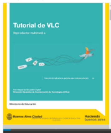
FIGURA 5. Descripción de la clase 3, objetivo, ect., además de un tutorial incrustado.

Tutorial de VLC, colección de aplicaciones gratuitas para contextos educativos