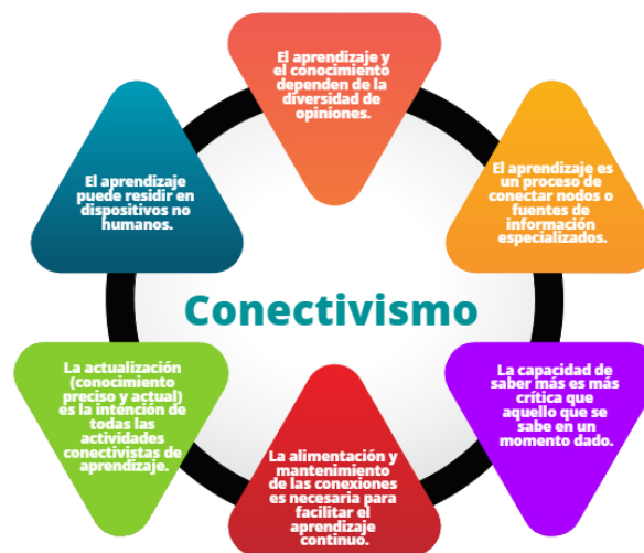
FIGURA 1. Algunos principios del conectivismo de Siemens.

El mundo en que vivimos está en constante cambio y actualización y obliga a hacer un análisis de la información recibida, para verificar su veracidad y fundamentación, por mencionar algunos aspectos. Algunos principios del conectivismo que resalta Siemens (2004) y que son acordes en proceso de alfabetización digital mediado en un curso presencial, pero con mayor relevancia en un curso virtual: