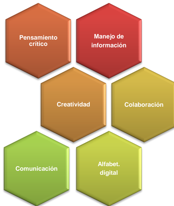
FIGURA 6. Algunas de las habilidades del siglo XXI.