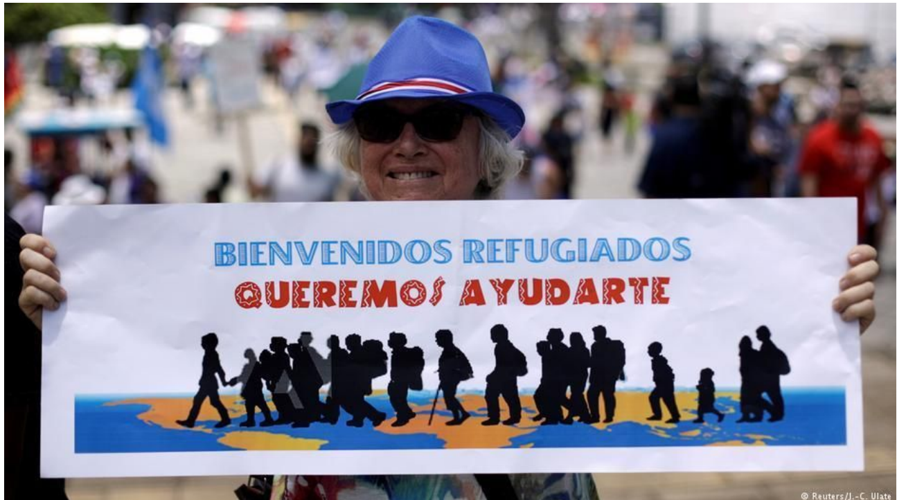
Costarriquense mostra um cartaz favorável aos refugiados em uma marcha anti-xenofobia e a favor dos nicaraguenses na Costa Rica.