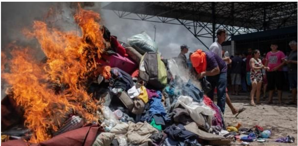
Roupas e objetos de venezuelanos queimados em Pacaraima (Roraima) na fronteira com a Venezuela.