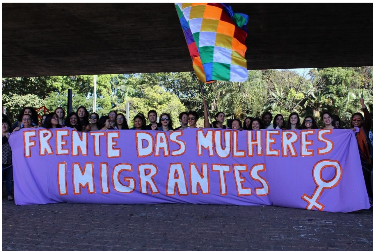
Frente das Mulheres Imigrantes na 10ª Marcha dos Imigrantes, São Paulo.