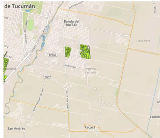
Figura 1: Barrios Vulnerables. Déficit de servicios básicos. (IPVyDU / OFUT).