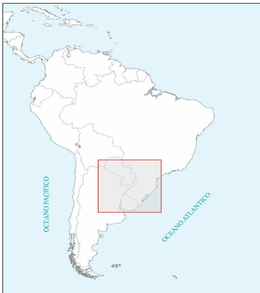
Mapa 1: Región Histórica del Nordeste rioplatense.

Consideramos pertinente mencionar el concepto de región que tomamos de referencia para identificar la vinculación Corrientes (Argentina) -Asunción (Paraguay), una idea de región que estuvo presente desde las primeras fundaciones en el siglo XVI y que implicó un nexo indiscutible desde aquellos tiempos entre ambas. En vísperas del proceso emancipador las realidades políticas, se diferenciaron y se desencadenaron de manera diferente. Esta idea de región que conecta el nordeste de Argentina con Paraguay, sur de Brasil, parte de Bolivia, Uruguay, nos vincula también a la idea de región de los antiguos 30 pueblos jesuíticos-guaraníes, la Provincia Jesuítica del Paraguay vigente desde mediados del siglo XVII hasta el momento de la Expulsión de los jesuitas en 1767.