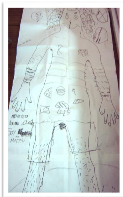
[12] Figura 2. Gráfico sobre el cuerpo (grupo focal, elaboración colectiva)

[11] (...) cuando estoy sola, no hago nada. Me siento más sola de lo que estoy. Me quiero morir, me quiero matar. Necesito a alguien que me escuche para no hacerme daño yo sola. (Laura, 13 años, relato de vida)