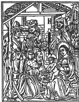
Bernardo de Breidenbach: Viaje de la Tierra Santa (Zaragoza: Paulo Hurus, 1498, fol. 71r)

Belén: lugar donde apareció la estrella y cita de San Mateo (obtención de indulgencias) – Altar de los Reyes Magos donde ofrecieron sus dones de oro, incienso y mirra (indulgencias) – [Grabado de los Reyes Magos en fol. 71r] (Tena Tena, 2003: 210; 212).