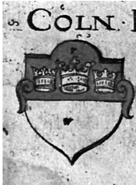
Virgil Solis, Wappenbüchen , Nürnberg, 1555, fol. 24