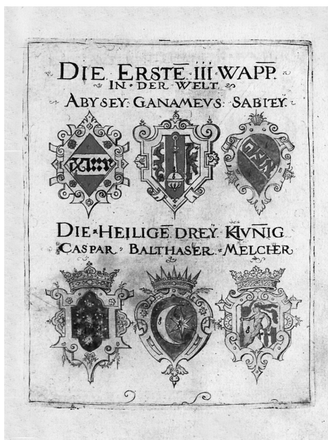
Virgil Solis, Wappenbüchlein , Nürnberg, 1555, fol. 13