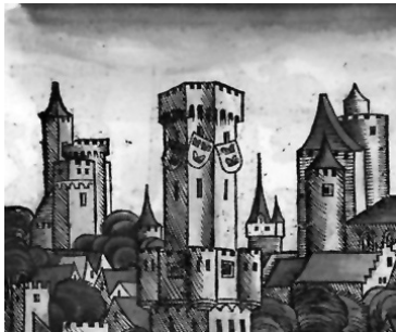
Hartman Schedel, Liber Chronicarum , Nuremberg: A. Koberger, 1493, 90v-91r

La primera de ellas tiene lugar en el capítulo concerniente a los blasones de reyes míticos y extranjeros. Menciona a los Reyes Magos a propósito de una referencia geográfica, ya que al tratar sobre las armas del Preste Juan lo ubica en la India, motivo suficiente para traer a colación la existencia de tres Indias, gobernadas oportunamente por los respectivos reyes, protagonistas en la adoración del Mesías (fols. 7v-8r). Así, Melchior era rey de Nubia y Arabia, en la primera India, y ofrendó el oro; Baltasar, que llevó el incienso, era rey de Gosolis y Esaua (o Godolis y Saba, en otros manuscritos), correspondiente a la segunda India; por último, Gaspar, soberano en Tarsis, Ynsúa y Grisola, en la tercera India, había obsequiado la mirra. Los tres fueron bautizados por el apóstol santo Tomás, luego nombrados obispos y finalmente muertos a causa de martirio. Dado que ninguno de ellos tuvo descendencia, los indianos procuraron elegir a alguien que los gobernase a todos pero que no tuviera nombre de rey ni de emperador sino que se llamase “Preste Juan, señor de las Yndias, como oy se llama, a quien siempre el fijo mayor suzediese como parece por el libro de la vida de los gloriosos reyes Magos” (fol. 8r). 14