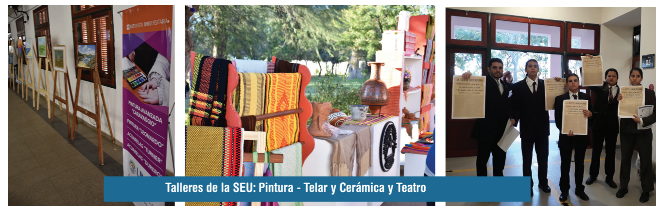
Talleres de la SEU: Pintura - Telar y Cerámica y Teatro