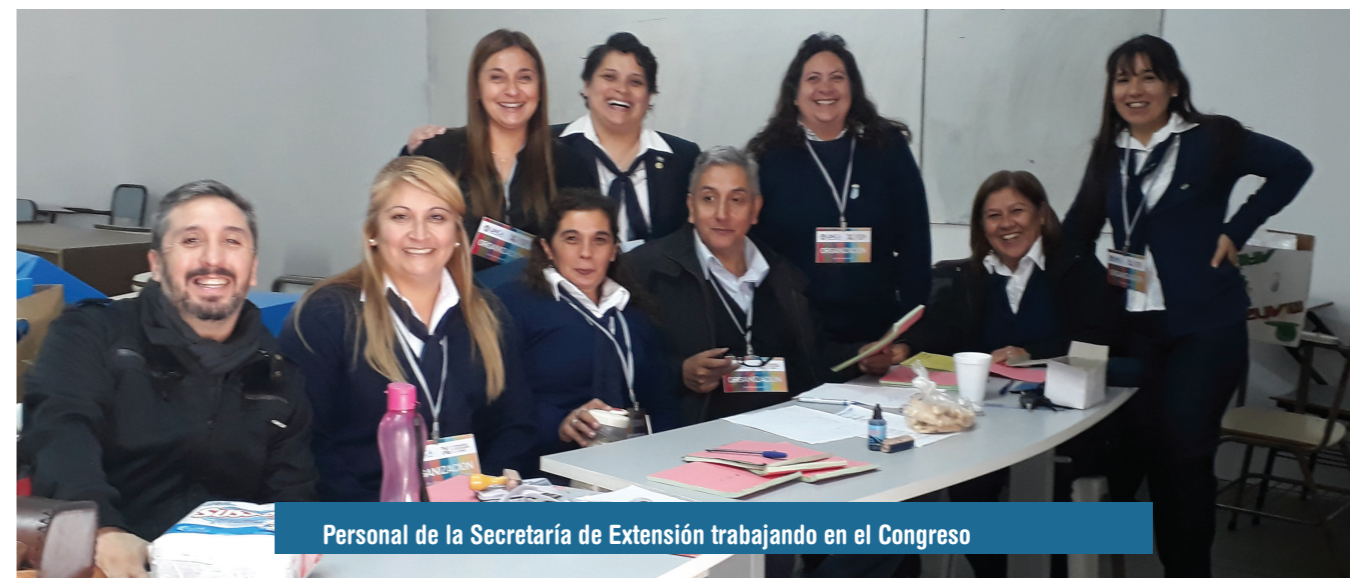
Personal de la Secretaría de Extensión trabajando en el Congreso