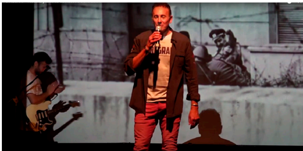
Figura 4. “... el Muro de la vergüenza cercenaba las libertades más elementales” (Guion del show). El momento de los aplausos tras la interpretación de la canción Libre de Nino Bravo