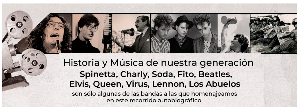
Figura 1. La marca Cinegraf y su hilo conductor