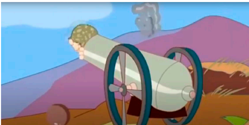
Figura 5. “Cómo puede crecer sana una generación que en su niñez escuchaba...” (Guion del show) Mambrú se fue a la guerra... (Voces de niños cantando)