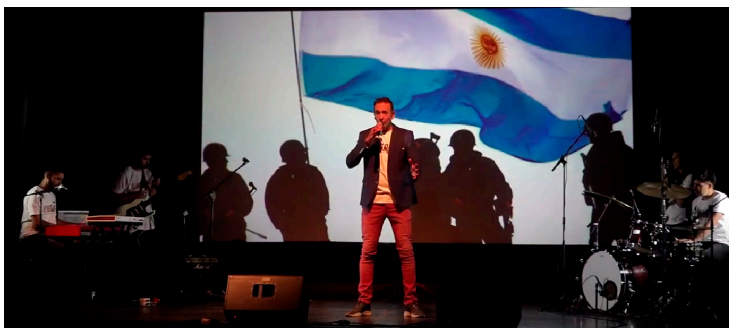
Figura 3. “Sonriendo despidió a su madre. Iba al sur del Atlántico. El reino lo ordenaba...” Interpretación de la canción Reina Madre , de Raúl Porchetto