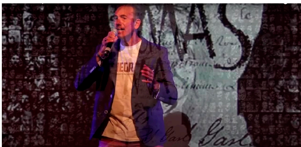
Figura 2. “La violencia en los 70” (Guion del show). Interpretación de la canción Los dinosaurios de Charly García