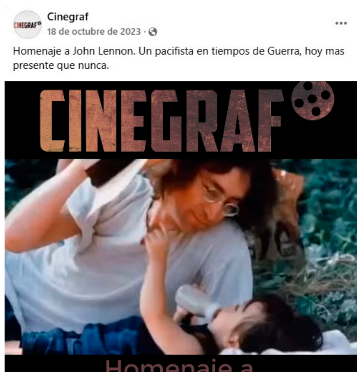
Figura 6. Homenaje a John Lennon. Un pacifista en tiempos de Guerra, hoy más presente que nunca (18-10-2023)

Fuente: Una de las imágenes incluidas en reel de homenaje a John Lennon. Publicación recuperada de la cuenta oficial de la banda: https://www.facebook.com/reel/3417602131812349