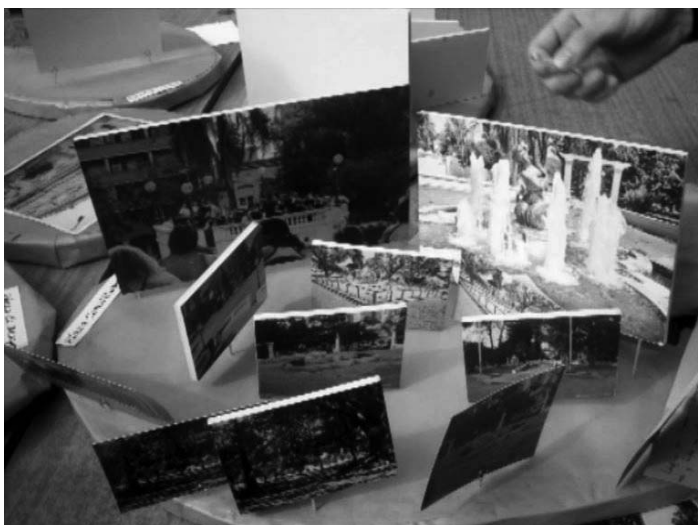
Figura 2: Elaboración de trabajos fotográficos sobre lo visible y lo invisible en la plaza.