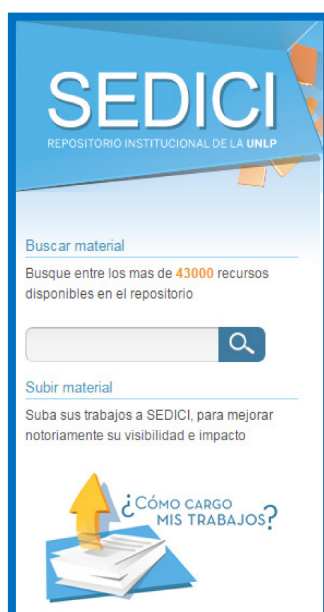
Figura 3. Captura de pantalla de la caja de búsqueda simple

SEDICI ofrece distintos modos de búsqueda con el objetivo de simplificar la tarea de localización de contenidos a sus usuarios. La forma más usada y simple es ingresar una palabra en el cuadro de búsqueda que se encuentra en la página de inicio del repositorio; varios análisis realizados a lo largo del tiempo sobre las formas de acceso al repositorio demostraron que este mecanismo se utiliza mucho más que una búsqueda compleja con selección de parámetros; por esta razón, la búsqueda simple se encuentra destacada en el home del repositorio en conjunto con el autoarchivo (Figura 3).