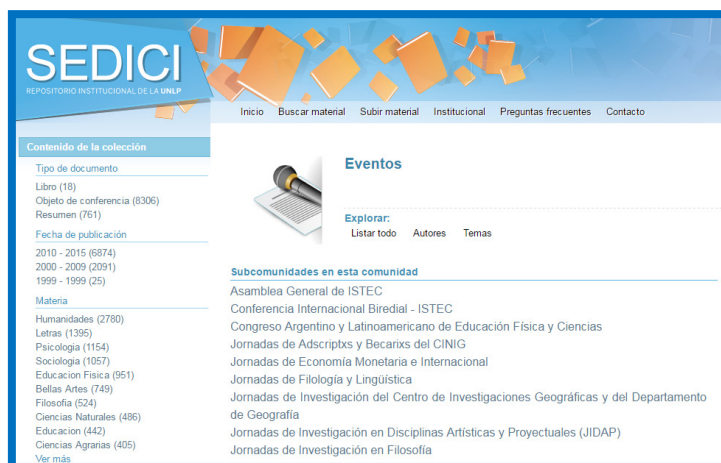
Figura 2. Capturas de pantalla de las comunidades de Revistas y Eventos en SEDICI