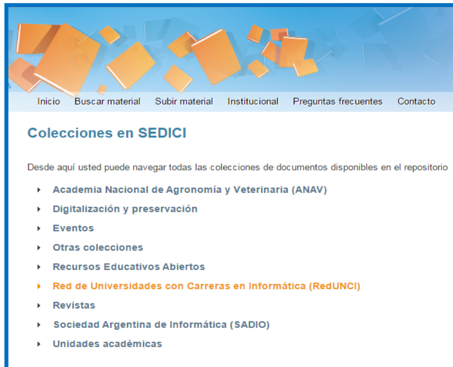
Figura 5. Captura de pantalla de las comunidades en SEDICI

La navegación en SEDICI brinda la posibilidad de tener una vista general de las comunidades y colecciones (Figura 5), y es un camino de localización de contenidos muy útil para quien desea conocer rápidamente el repositorio, así como para el propio autor/autoridad/gestor dentro de la UNLP, para el que, la manera más natural de localizar una obra es buscarla en las comunidades que siguen la forma en que se administra la propia universidad, es decir por unidades académicas, como ya se explicara.