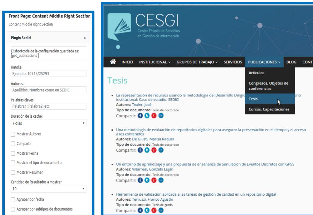
Figura 7. Izquierda: formulario de configuración de URL OpenSearch en Wordpress. Derecha: resultados de búsqueda OpenSearch integrados a un portal de un centro de I+D