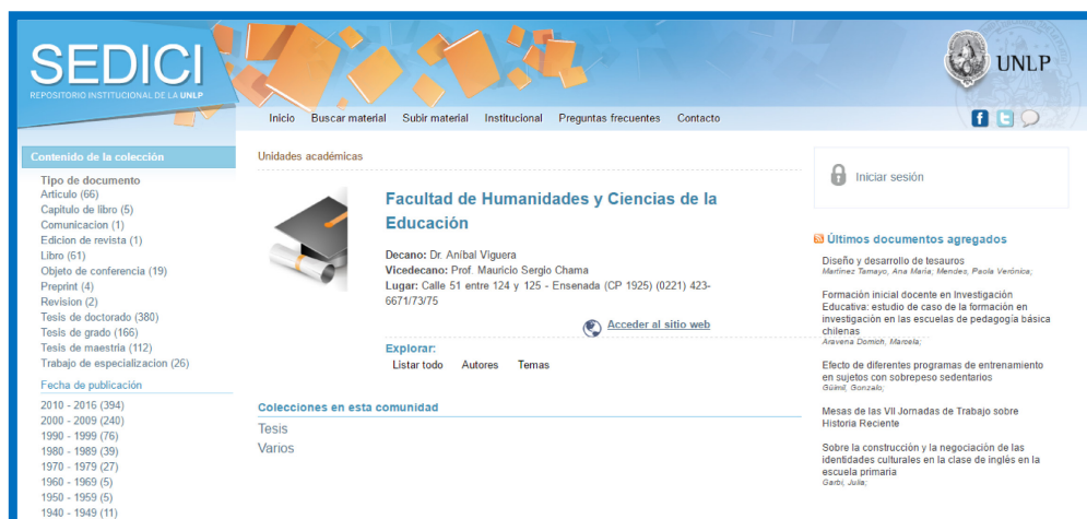
Figura 1. Captura de pantalla de la comunidad de la Facultad de Humanidades y Ciencias de la Educación en SEDICI

La organización de los contenidos en SEDICI responde a la estructura organizativa de la propia UNLP, es decir, que las comunidades que albergan las distintas colecciones son las propias unidades académicas y otras dependencias de la UNLP; dentro de esas comunidades, pueden existir subcomunidades y colecciones donde están los contenidos depositados, como puede verse en la Figura 1.