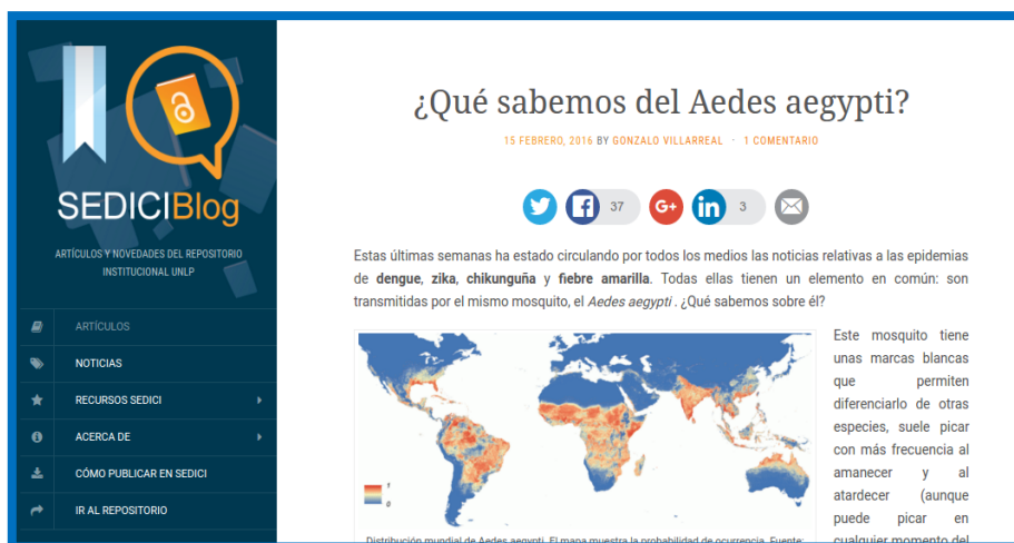
Figura 9. Página principal del blog institucional de SEDICI