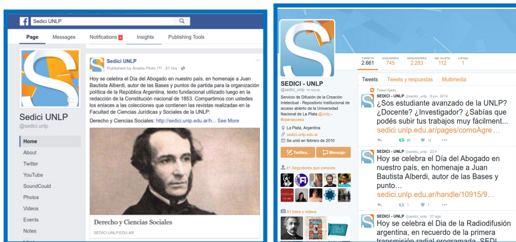
Figura 8. Izquierda: página institucional de SEDICI en Facebook; derecha: Twitter de SEDICI

información para optimizar los días, horarios, formatos de los artículos y tipos de materiales a difundir. Con esta misma metodología, se utiliza la red social GooglePlus y la red de profesionales LinkedIn, y se generan textos breves para Twitter. Esta última red social se utiliza también para participar en trending topics relacionados con eventos en curso (congresos, simposios, etc.).