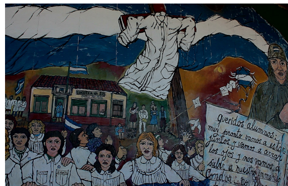
Figura 11. Estacion G. de Laferrere. Autor: Santiago Vilas.