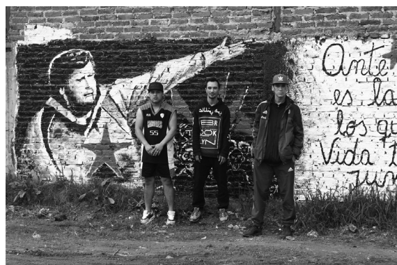
Figura 8. Mural realizado en las paredes del barrio Vicente Lopez en Villa Celina por el Movimiento Popular La Dignidad en honor al militante Dario Julian, conocido como "Iki", asesinado en 2017. Autora: Lorena Itati Galarza.