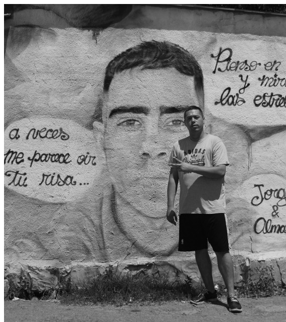
Figura 7. Barrio Puerta de Hierro. La Matanza.

Uno de los acontecimientos que reconfiguró este tipo de prácticas fue la llamada "Tragedia de Cromañón". El 30 de diciembre del año 2004 se incendió un local destinado a shows de música en vivo, ubicado en el barrio de Once (Ciudad de Buenos Aires), denominado "República Cromañón" regentado por el empresario Omar Chaban. Ese día tocaba en vivo el grupo de rock Callejeros, del cual muchos de sus integrantes eran oriundos de La Matanza. La tragedia de Cromañón dejó un saldo de 194 muertos y al menos 1.432 heridos, muchos de ellos vecinos locales. El hecho marcó definitivamente a la zona, la cual comenzó a retratar la imagen de los caídos en distintas esquinas de Villa Celina, Villa Madero y Gonzalez Catan entre otros barrios.