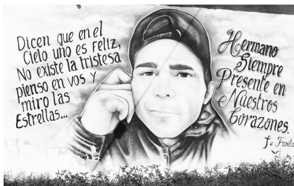
Figura 6. Barrio 22 de enero. La Matanza. Autor: Manny.

Este tipo de murales es encargado y pagado por los familiares o amigos del difunto a diversos artistas que se dedican a esta actividad. Entre los más destacados podemos mencionar a Víctor Marley del barrio de Villa Celina y Mauricio Pepey "Uasen" del barrio de González Catan.