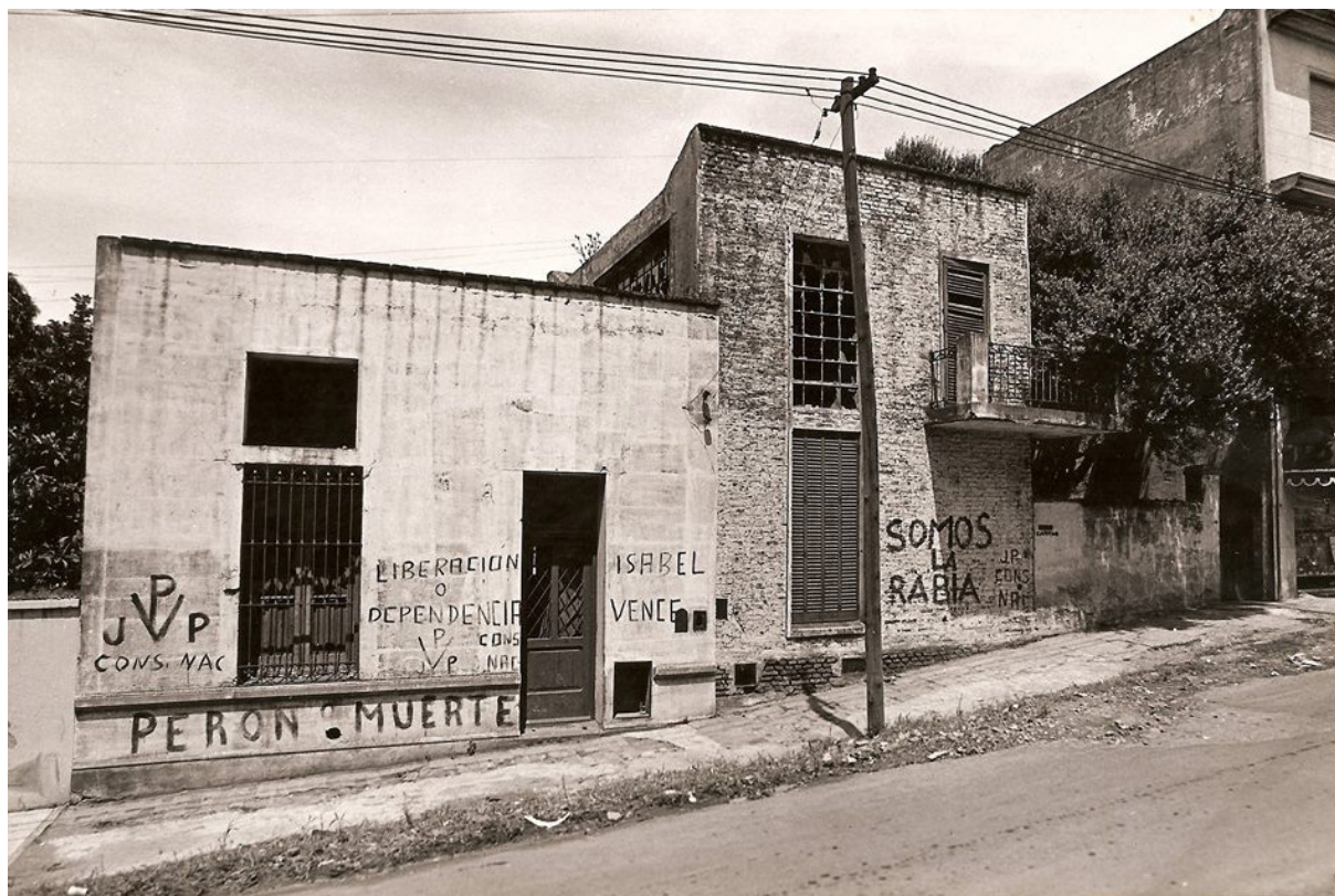
Figura 2. Villa Insuperable. Paredes pintadas con slogans políticos. Inicios de 1970.