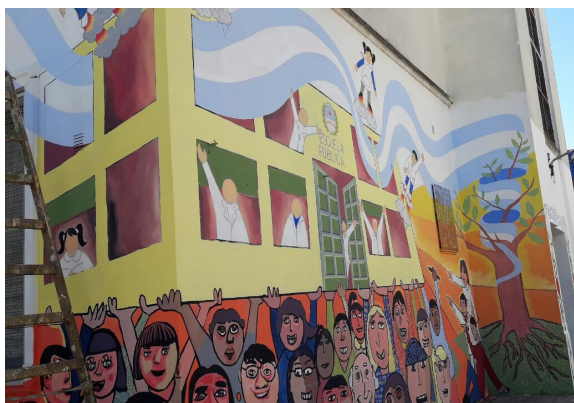
Figura 9. Mural en escuela 9 de Villa Madero. Foto:

Este proceso de diálogo intercultural encierra valor representativo en el desarrollo de los procesos de integración, de identificación y de protagonismo social de los jóvenes en la escuela. En ese contexto, la Dirección General de Escuelas propuso para los festejos del bicentenario de la revolución de mayo, el 25 de mayo en el 2010, se trabajara el muralismo desde las escuelas. Se conformaron talleres para que los docentes de las escuelas aprendieran diferentes técnicas, incluyendo las más modernas como, por ejemplo, el mosaiquismo. Esta propuesta multiplicó los proyectos de muralismo en y por escuelas en todo el distrito.