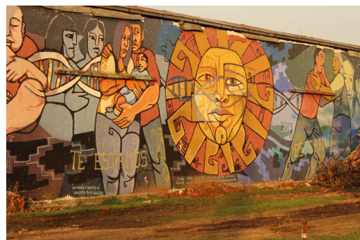
Figura 4. Mural de Lucas Quinto y Ariel Calo, San Justo.

Su iconografía representa elementos de la cultura popular (el pan, el sol, la mano de los trabajadores, el fútbol, la bandera, los pueblos originarios, etcétera), como así también personajes de neta raigambre popular: Evita, Rodolfo Kusch, Scalabrini Ortiz, Arturo Jauretche, entre otros. En el contexto del actual gobierno argentino (2015-2019), caracterizado por la implementación de políticas neoliberales y recortes económicos en cuanto al presupuesto de educación y salud, sumado a una marcada flexibilización laboral y la consiguiente pérdida de derechos para la población, y que ocasionó diversas marchas y reclamos en el espacio público por los sectores sociales más vulnerados, la obra de Santiago comenzó a alternar la realización de murales en distintas paredes públicas con la realización de lo que él denomina "trapos militantes". Este nuevo estilo consiste en la realización de murales "móviles" realizados en soportes de tela (trapos) para poder ser trasladados y expuestos en las distintas marchas de reclamos políticos y sociales que se vienen realizando desde 2015. Esta nueva etapa resignifica el uso del espacio público, y crea la necesidad de poder llevar el discurso artístico a las calles y poder hacerlo móvil. En ese sentido el discurso deja de ser estático y "marcha" como reclamo.