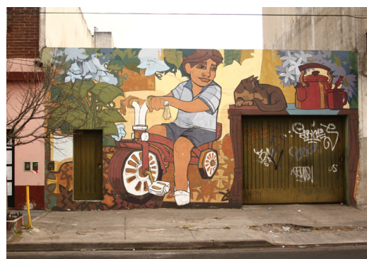
Figura 5. Mural de Julian Crigna, Villa Celina.