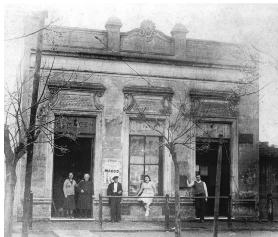
Figura 1. Almacén familia Vega, La Matanza, circa 1935. Nótese afiche pegado en el frente anunciando show del bandoneonista Antonio Maggio.

Este subgénero fue evolucionando hasta convertirse en uno de los métodos comunicacionales por excelencia para la militancia política. Los grupos encargados sistematizan el trabajo: un vehículo, el chofer y campana 1 , los "realizadores" y la clandestinidad de la noche.