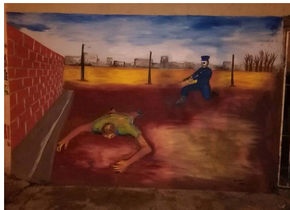
Figura 15. Mural en el barrio de González Catán denunciando "el gatillo fácil". Debíó ser tapado ante la presión.

En el barrio de González Catán, un grupo de artistas realizó sobre una pared un mural denunciando los casos de gatillo fácil. Ante la presión policial debió taparse parte del mural.