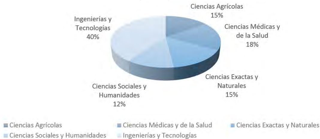
Figura 3. Porcentaje de proyectos según disciplina