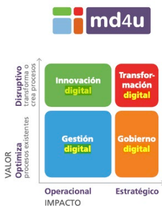
Figura 1: Cuadrícula de Madurez Digital del Modelo md4u (Gómez Ortega, 2021: 10)

Tras la pandemia, desde CRUE Universidades españolas se impulsó un modelo muy definido, altamente estructurado y sumamente concreto de qué es la universidad digital: el Modelo de Madurez Digital para Universidades ( md4u ) (Fernández Martínez et al., s.f.; Gómez Ortega, 2021). Dicho modelo está formado por tres elementos clave: una cuadrícula de madurez digital, el marco de referencia y un catálogo de buenas prácticas.