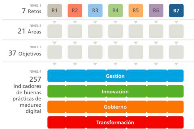
Figura 2: Estructura global de marco md4u (Gómez Ortega, 2021: 11)

de madurez digital, ayuda a establecer objetivos de mejora y a comprender cuales son las prácticas más adecuadas para aumentar su madurez digital.