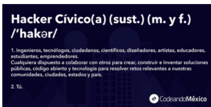
Figura 1. Hacker cívico https://twitter.com/codeandomexico?lang=es

El objetivo era desarrollar durante una semana una aplicación de código libre que sustituyera el software por el cual el gobierno federal pretendía pagar 115 millones de pesos. Al reto se presentaron más de 150 participantes; se desarrollaron 5 apps de código libre para móviles; 3 aplicaciones web para entregar datos a plataformas móviles, y se hizo pública una API ( Wilhelmy , 2013b). Las propuestas fueron