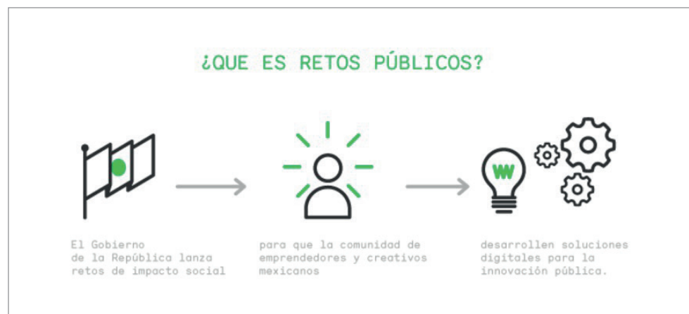
Figura 5. Retos públicos http://retos.datos.gob.mx/acerca

La iniciativa de Retos públicos se vinculó e integró posteriormente como una estrategia del Gobierno Federal para el cumplimiento de los objetivos planteados en la Estrategia Digital Nacional presentada en noviembre de 2013 (Gobierno de México, 2014). El proyecto Retos públicos consiste en el desarrollo de convocatorias abiertas para presentar propuestas de solución digital a demandas de la adminis-