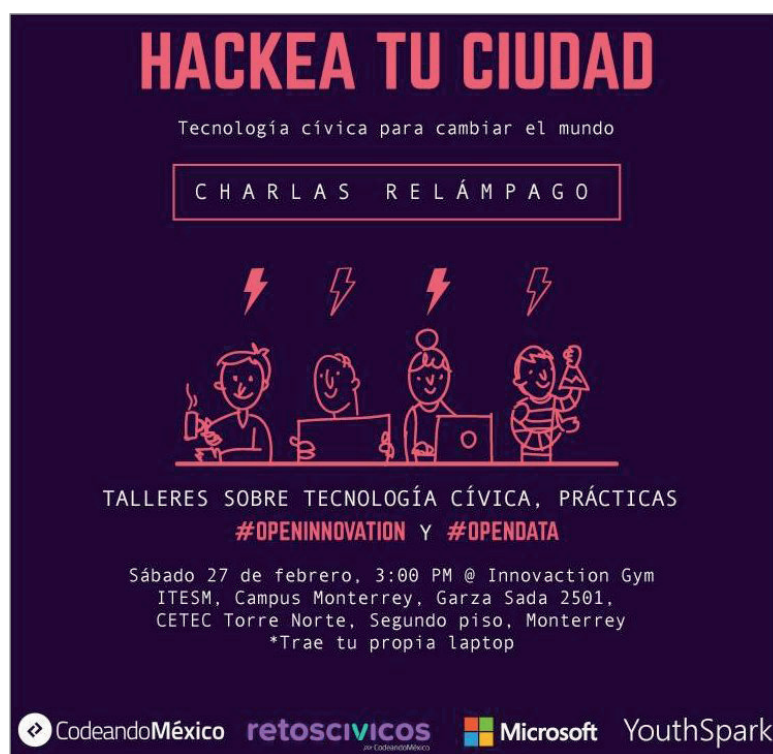
Figura 8. Hackea tu ciudad https://www.facebook.com/CodeandoMexico

des son: hackathones cívicos , civicHackNight (tertulias de temas hackers), Hackea tu ciudad (charlas relámpago, talleres y entrenamientos sobre tecnología cívica).