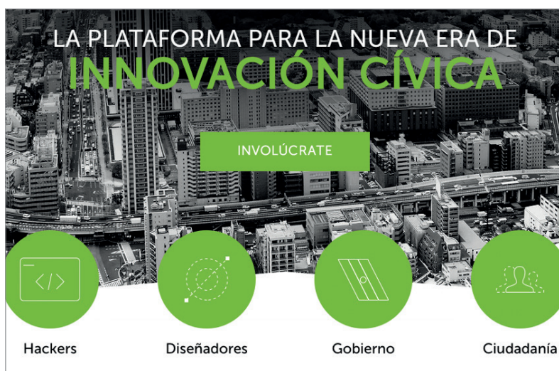
Figura 3. Plataforma de innovación cívica https://espaciocritico25.files.wordpress.com/2014/11/codeandomexico.jpg

Después de la #App115, Codeando México lanzó en mayo de 2013 la plataforma cívica de datos abiertos DataMX . La intención era abrir datos desde la sociedad civil como alternativa a la iniciativa gubernamental datos.gob.mx que carecía de mecanismos claros para publicar nueva información e involucrar al ciudadano en el proceso ( Codeando , 2013c). El objetivo fue proporcionar un espacio autónomo para la publicación y consumo de datos, independiente de cualquier gobierno u organización. Se buscaba que fuera una herramienta alineada con los estándares de proyectos e iniciativas internacionales como la Open Government Partnership y la Open Knowledge International que promueven la apertura de datos como parte de las estrate-