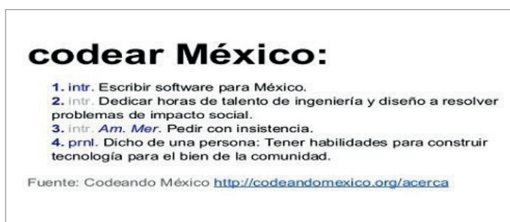
Figura 2. Codear México

presentadas el 4 de abril ante los diputados y se dictaminó la propuesta de Arturo Jamaica como la aplicación ganadora. Lamentablemente y sin explicación alguna, hasta el día de hoy la aplicación no ha sido adoptada por el Congreso ( Morato-Mungaray , 2015).