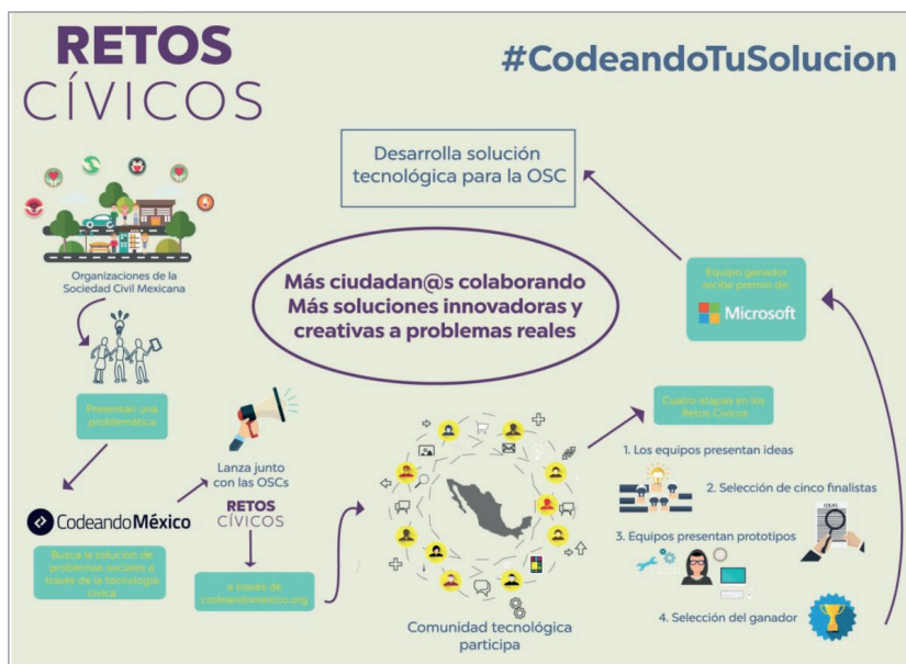
Figura 7. Retos cívicos http://retoscivicos.codeandomexico.org/#

A través de estas comunidades, Codeando México no busca dar una solución a un problema social en particular, sino agrupar a todas las personas interesadas en generar soluciones a los problemas que una o varias comunidades pue-