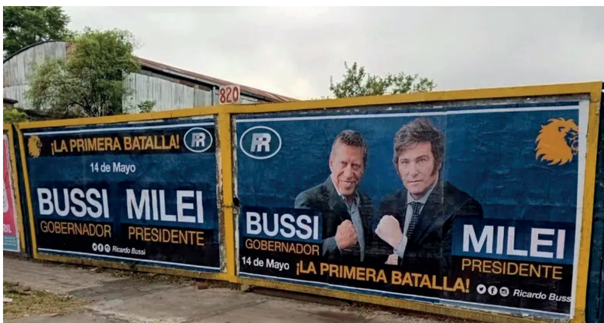
FIGURA 1. PROPAGANDA POLÍTICA

Más recientemente, el gobierno de Macri (2015-2019) –también denominado como "nueva centro derecha" (Vommaro, 2016)- transcurrió su administración con un Estado comandado por gerentes empresariales que ya entonces difundía una 'moral emprendedora' basada en el siempre cínico postulado de la 'meritocracia individual'. Presentaba la novedad de ser el primer gobierno cuyo candidato a presidente provenía del empresariado y que abiertamente invocaba un modelo de economía neoliberal, a diferencia de lo que había sucedido con Menem.