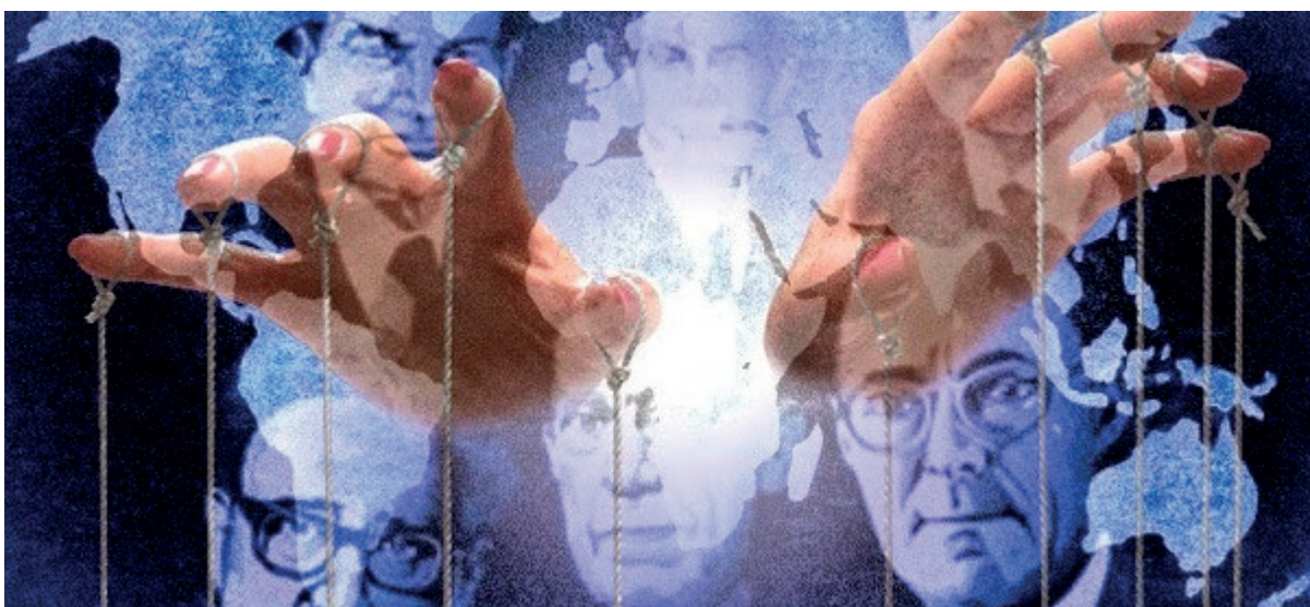
FIGURA 2. LOS QUE MANEJAN LOS HILOS DEL MUNDO

Por otro lado, opone otra imagen de las conspiraciones derivada de los escritos de Maquiavelo: las 'conjuras'. Podríamos decir que, tanto en su obra El Príncipe (2012) como, y especialmente, en Los Discursos sobre la Primera Década de Tito Livio (2000), le dedica una atención especial para referirse a la forma en que los hombres dirimen sus conflictos políticos no solo para acceder al poder, sino que, a su vez, lo describe como un mecanismo utilizado para vengarse de aquellos que usan el mismo de manera arbitraria 7 .