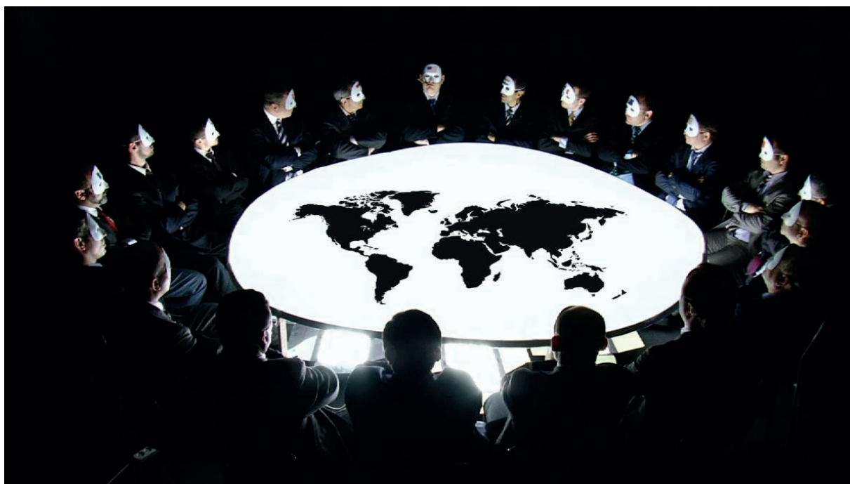
FIGURA 1. CONSPIRACIONES Y POLÍTICA