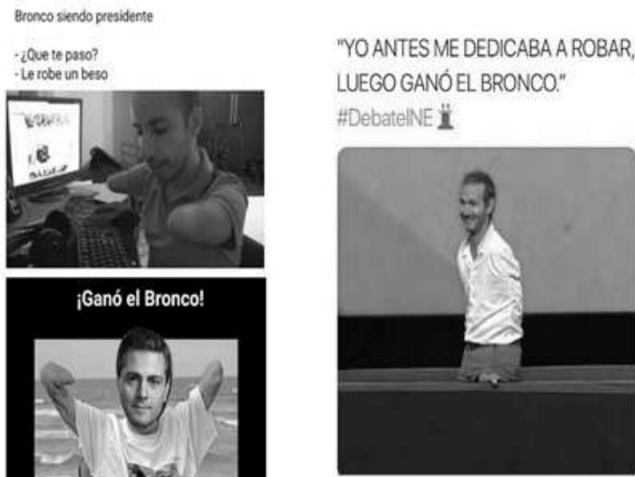
Ilustración 1. Memes de mancos / Descripción: imagen superior izquierdo “una persona 'sin manos' frente a un monitor de computadora y un teclado, arriba un diálogo ‘Bronco siendo presidente. - ¿Qué te pasó?, - Le robé un beso’”; imagen inferior izquierdo “El rostro del expresidente Enrique Peña Nieto montado sobre un cuerpo “sin manos”, arriba la frase ¡Ganó el bronco!”; imagen derecha “Nick Vujicic impartiendo una de sus conferencias. Arriba el texto ‘Yo antes me dedicaba a robar, luego ganó el bronco. #DebateINE’”.

Lo que quiero señalar con esta escena es que la discapacidad no apareció en el marco de la democracia y el pluralismo, sino ante todo como cuerpos que sirven para instrumentalizar una metáfora de la descomposición, la perversión o la “lucha contra la corrupción”. La injuria juega con nuestra moral: manco = corrupto / íntegro (“sin discapacidad”-“con manos”) = honesto . Melania Moscoso (2013) recuerda que la representación de la discapacidad está vinculada siempre a un aleccionamiento moral, exhibiéndola en modelamientos de subjetivación colocados en la ambivalencia del castigo o la inspiración.