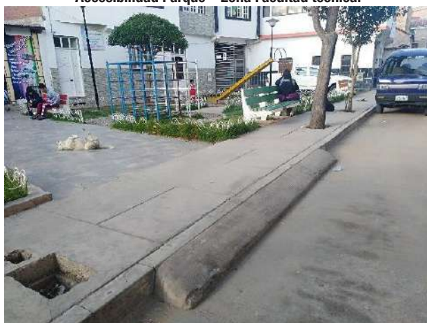
Imagen 7 Accesibilidad Parque – Zona Facultad técnica.