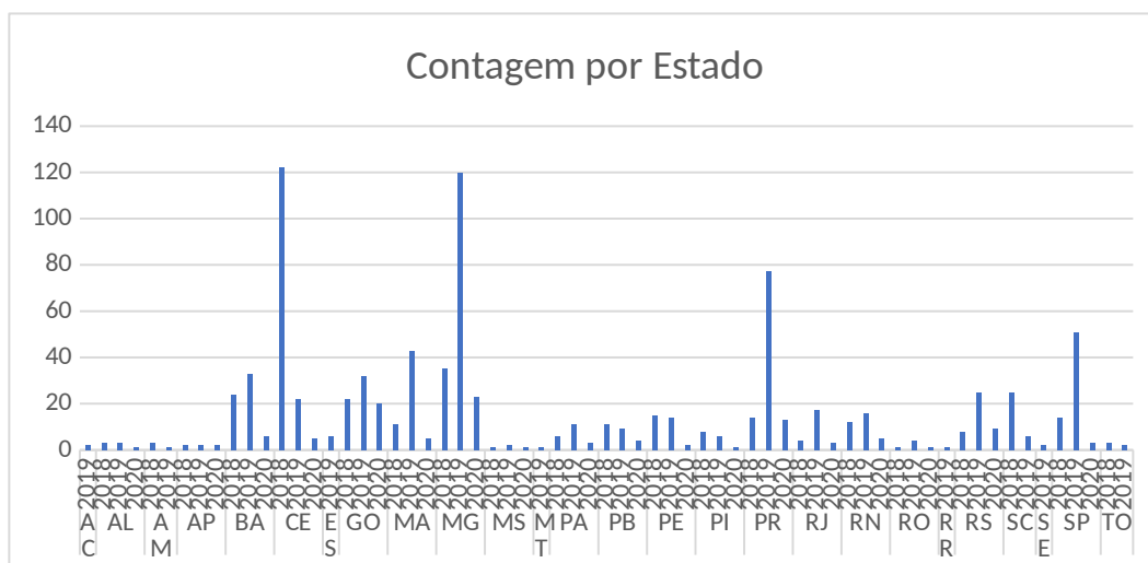
FIG.1(dados in https://www.gov.br/cidadania/pt-br/acoes-e-programas/outros/pt-br/acoes-e-programas/brasil-amigo-da-pessoa-idosa/situacao-atual )

No ano de 2018, quando houve o lançamento, Ceará, Bahia, Santa Catarina e São Paulo foram os estados com mais municípios aderindo a estratégia. Em 2019, o destaque foi para o Paraná e em 2020 foi para Minas Gerais. Percebe-se que as demais regiões tiveram uma baixa adesão nesses três anos.