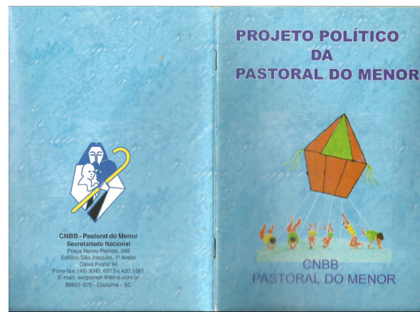
Figura 3 – Caderno de formação Projeto Político da Pastoral do Menor .

No Projeto Político da Pastoral do Menor , enquanto a mística justificava a vinculação teológica do catolicismo com a ação social, a análise de conjuntura aportou dados do Instituto Brasileiro de Estatística (IBGE) e da Associação Brasileira Multiprofissional de Proteção à Infância e Adolescência (ABMPIA) para corroborar o ainda necessário engajamento católico com a realidade social do país. Para o ano de 1999, a conjuntura apontava cerca de 40% da população infantojuvenil brasileira em situação de miserabilidade, vivendo em grupos familiares cuja renda não passava de meio salário-mínimo (CNBB, 1999). O livreto-documento mobilizava um círculo vicioso que envolvia a criança, primeiro, vulnerabilizada, em vivência de rua, e paulatinamente encaminhada ao trabalho precário e ao conflito com a lei. Essa trajetória da experiência da menoridade, como abordada, não havia sido transformada em relação ao paradigma menorista, que persistia vigente nos anos 1990, fosse na cultura das forças policiais, na institucionalização ou no senso comum, interpelando a Igreja e a Pastoral a um trabalho de sensibilização que avançou no período da Nova República.