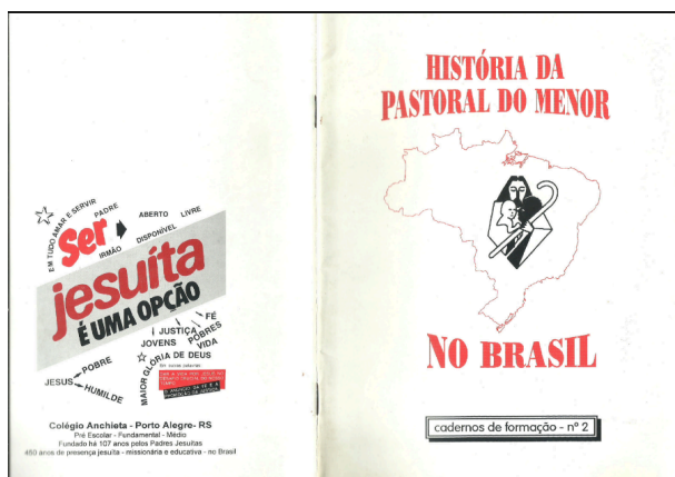
Figura 1 – Caderno de formação História da Pastoral do Menor .