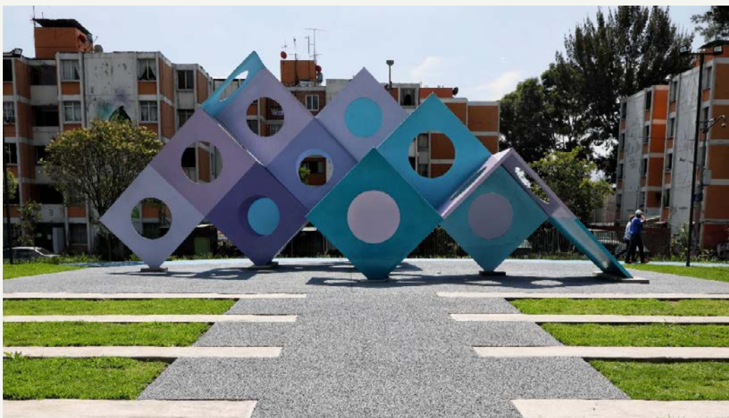
v Escultura en la Unidad Habitacional Vicente Guerrero, 2021.