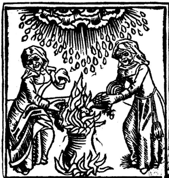
Ilustración 3: Brujas conjurando un chaparrón de lluvia (1489). Grabado extraído del libro Calibán y la bruja