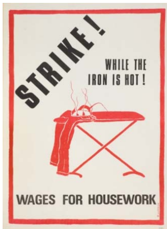
Ilustración 1: "¡Huelga! Mientras la plancha está caliente". Folleto de la Campaña por el Salario para el trabajo doméstico