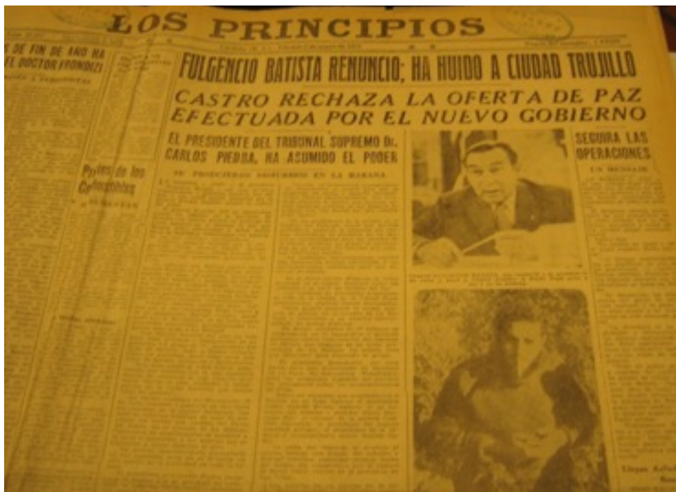
En la fotografía se observa al dictador derrocado y al joven Fidel Castro, líder de la revolución

Fotografía: solo se encontró en la edición del viernes 2 de enero de 1959