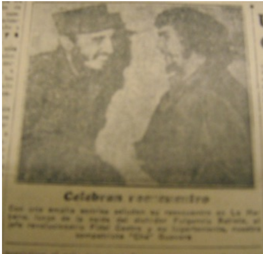
Pie de foto: celebran y se encuentran