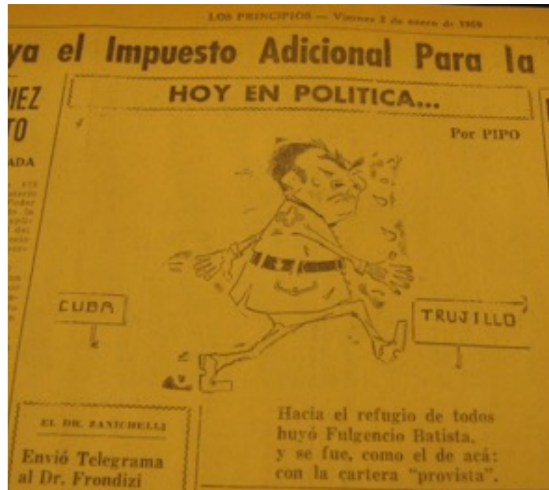
Caricatura del humorista Pipo

Desde el martes 6 de enero, se publica la imposición de la Ley marcial en Cuba, la que continua en los días siguientes al dar la noticia de que “se muestran muy deprimidos los extorturadores cubanos (de Batista) en un total de 180 hombres”.