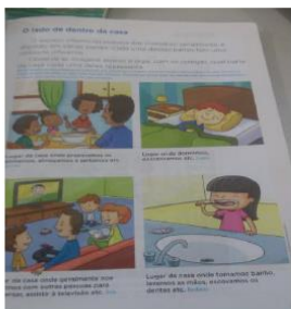
Figura 1- Livro didático de Geografia

sociedade excludente e de uma escola seletiva (SILVEIRA BUENO, 1997, p.53).