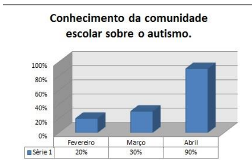
Gráfico 3 – Conhecimento da comunidade escolar sobre o autismo

Durante a realização deste projeto, percebemos o quanto é importante buscarmos novas formas de ensinar e acima de tudo acreditarmos na capacidade de cada aluno de aprender, olhando sempre as suas habilidades como ponto principal para a realização de qualquer atividade pedagógica, procurando sempre estimulá-lo e motivá-lo na realização das atividades propostas.