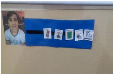
Figura 6 – Agenda Sala de aula de Ensino Regular

Todos os dias, a agenda do aluno é organizada de acordo com a rotina de cada dia da semana, com o uso de gravuras que dizem o que ele fará durante aquele dia. Elas são dispostas sequencialmente de cima para baixo ou da esquerda para a direita, procurando manter sempre a rotina, para não gerar desconforto para o aluno.