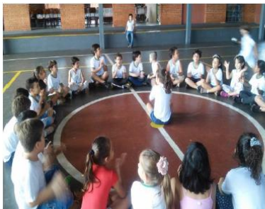
Figura 11- Galinha do vizinho

aluno as atividades a serem realizadas em sequência como: saltar, abaixar, levantar, empilhar, quicar, lançar, chutar, equilibrar e alongar.