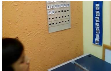
Figura 7- Agenda Sala de Atendimento Individual