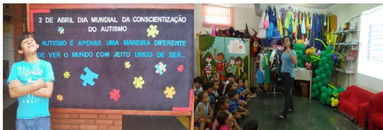
Figura 15- Mural e Palestra sobre o autismo

No dia 2 de abril é o Dia Mundial da Conscientização do Autismo, e durante essa semana, toda a escola vestiu-se de azul (tema da campanha) e foram realizadas palestras para os alunos e professores sobre o autismo e a inclusão escolar.