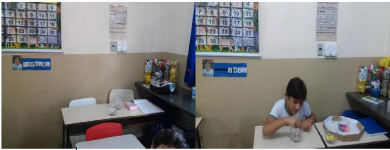
Figura 5 – Estrutura TEACCH na sala de aula de ensino regular

Todos os dias, a agenda do aluno é organizada de acordo com a rotina de cada dia da semana, com o uso de gravuras que dizem o que ele fará durante aquele dia. Elas são dispostas sequencialmente de cima para baixo ou da esquerda para a direita, procurando manter sempre a rotina, para não gerar desconforto para o aluno.