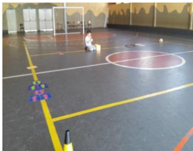
Figura 12 – Circuito Adaptado

Frequenta as aulas de Biblioteca que o ajuda a experimentar situações sociais e refazê-las através de contação de histórias, filmes e teatros.