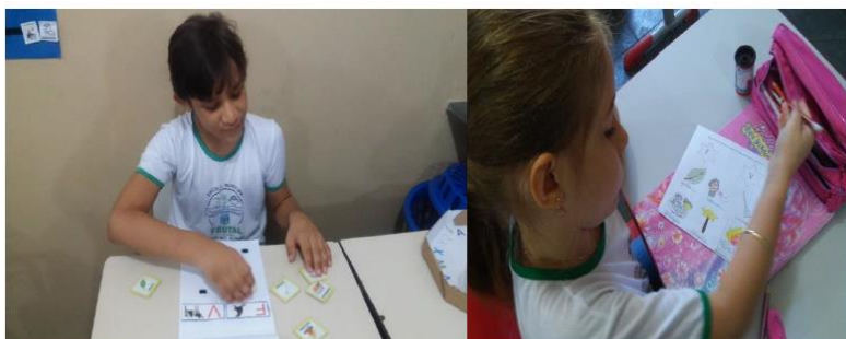
Figura 8 – Atividade adaptada do currículo comum

O aluno permanece por um tempo aproximado de 2 horas na sala de aula de ensino regular, realizando junto aos demais alunos as atividades propostas pela professora, sendo estas adaptadas pelo profissional de apoio de acordo com os princípios da Estrutura TEACCH.