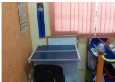
Figura 10- Mesa independente (atividades que o participante consegue fazer sozinho)

Ele participa também uma vez por semana das aulas de Educação Física, com atividades que trabalham regras, equilíbrio, coordenação motora e agilidade. Como competições entre equipes, corridas, queimada e incluindo também o “volta a calma” com brincadeiras do tipo galinha do vizinho, batata quente, telefone sem fio e passa anel. Também são trabalhados, circuitos adaptados que possibilitam um melhor desenvolvimento das habilidades sociais, coordenação motora e concentração os quais são constituídos através de referências que indicam ao