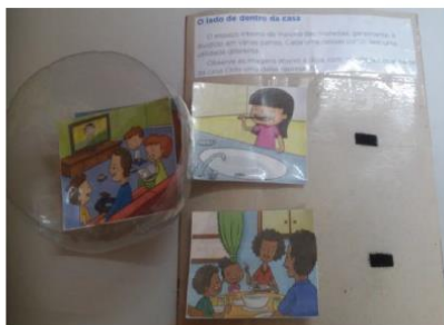
Figura 2- Atividade adaptada do livro didático

Nas figuras acima apresentamos algumas formas de adaptação do livro didático de Geografia Porta Aberta de Mirna Lima (2011), a partir da Estrutura TEACCH, usando o esquema de trabalho que utiliza os sistemas visuais, a indicação visualmente mediada, a previsibilidade, instruções visuais e sistemas que enfatizam o que o aluno tem que fazer transformando o conteúdo, de verbal para não verbal.