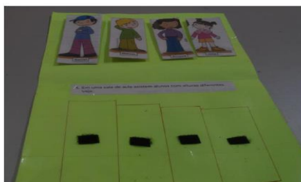
Figura 4 – Atividade adaptada do livro didático

Olhando para a atividade o objetivo deverá estar o mais claro possível para aumentar o engajamento do aluno, independente do instrutor. Muitas vezes o livro didático traz detalhes desnecessários, informações que não fazem parte do conceito que queremos ensinar, estímulos que podem chamar mais a atenção que a tarefa em si, elementos soltos que podem ser facilmente destruídos, podem vir sem cor, etc.