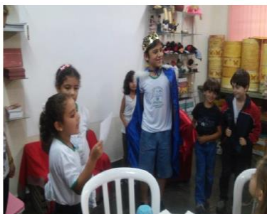
Figura 14 – Representação (Teatro)