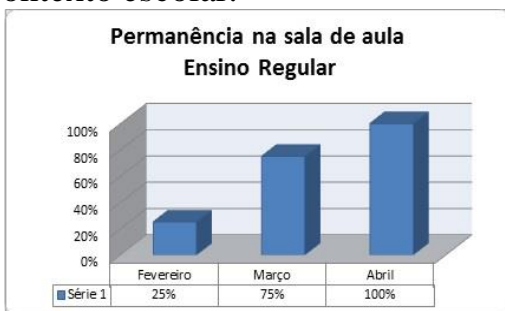
Gráfico 1 – Permanência na sala de aula de Ensino Regular

até o 100. Sua coordenação motora grossa e fina melhorou e suas habilidades de socialização estão mais efetivas. Portanto, a realização deste projeto foi importante para toda a comunidade escolar que perceberam visualmente as melhoras do aluno com autismo no contexto escolar.