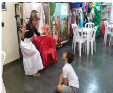
Figura13- Contação de história

Frequenta as aulas de Biblioteca que o ajuda a experimentar situações sociais e refazê-las através de contação de histórias, filmes e teatros.