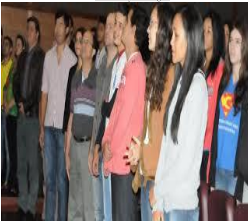
Figura 2: “Alunos da Escola Estadual Vicente Macedo na Feira de Profissões”.