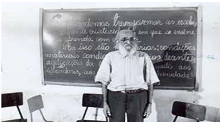
Figura 3: “Paulo Freire”.