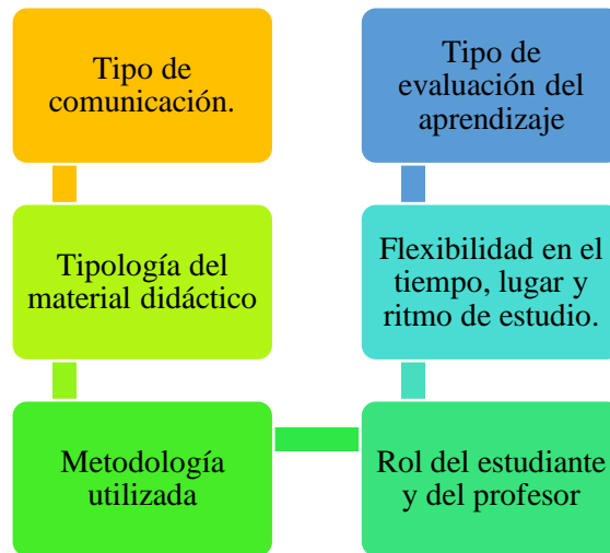
Figura 3 Elementos de la dimensión pedagógica