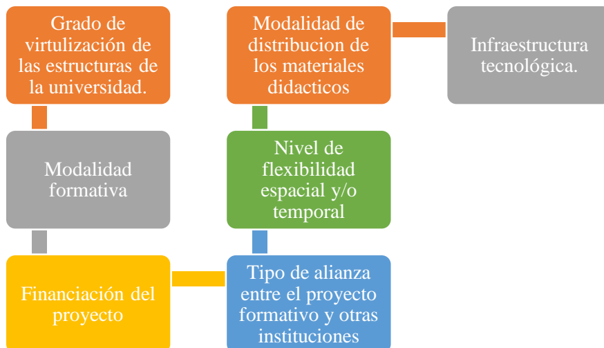
Figura 2 Elementos de la dimensión organizativa

Los componentes de la dimensión organizativa destacan múltiples elementos los cuales se observan en la figura 2.