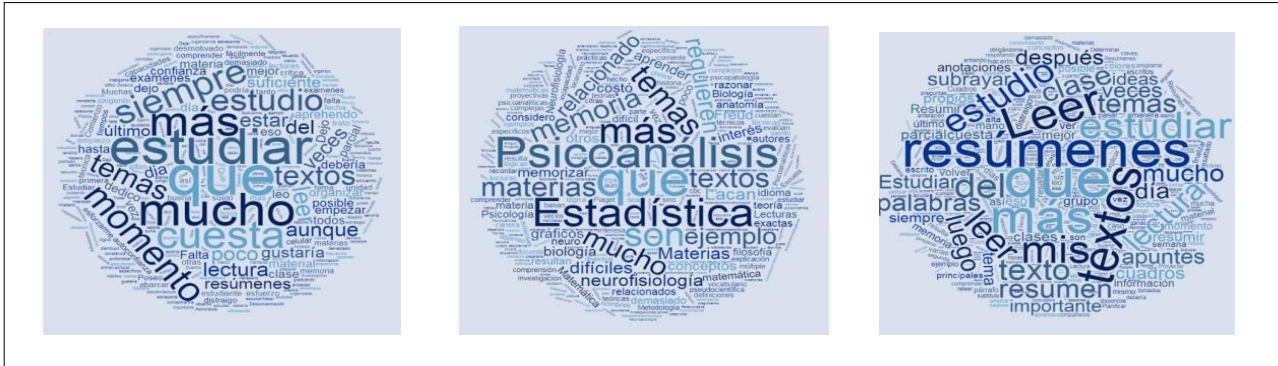
Figura 1. Nube de palabras, preguntas uno a tres ordenadas de izquierda a derecha. Pregunta 1: ¿Qué autocrítica tienes como estudiante?; pregunta 2: ¿Qué tipo de lecturas/temas/materias de la carrera te resultan más difíciles para estudiar?; pregunta 3: ¿Qué acciones/estrategias te resultan más exitosas en el estudio de las materias universitarias?