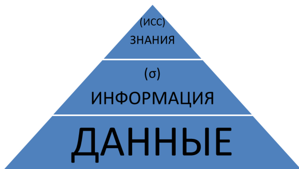
Рис. 1. Иерархия информации

Одной из задач любой науки является получение и формирование информационных ресурсов в предметной области данной науки [10]. Современные информационные ресурсы включают различные компоненты: данные, информацию, описания, базы данных, знания и технологические системы [4, 5]. В информационном поле присутствует такой феномен как «неявное» знание, такое обозначает наличие отношений и характеристик в природе информации. Такое отношение известно как иерархия информации или пирамида Акоффа, которая может быть представлена следующим образом на Рисунке 1.