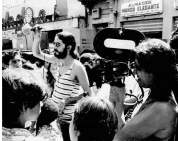
Figura 3. [Imagen de Luis Ospina y Carlos Mayolo durante el rodaje de Cali: de película ].

En el caso del documental Cali: de película , este sirve como fuente histórica por los siguientes elementos: