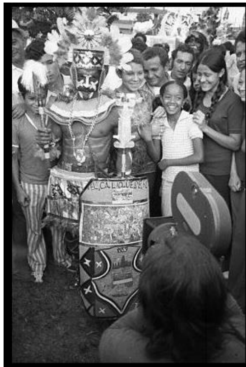
Figura 2. Carvajal, E. (1972). Rodaje de Cali: de película [fotografía]. Recuperado de http://www.luisospina.com/archivo/grupo-de-cali/cali-de-pel%C3%ADcula-1973/ [27 enero 2016]

reflejado en filmes colombianos como Garras de oro , (P.P Jambrina, 1926), que muestra cómo el gobierno colombiano cedió ante las presiones y ofrecimientos de Norteamérica para entregar una parte de Panamá, con la única finalidad de permitirle a una fuerza extranjera el desarrollo de un proyecto interoceánico para beneficiar el crecimiento de su economía (Manrique, 2014); o en los documentales de Carlos Mayolo y Luis Ospina que evidencian las problemáticas, la cultura popular, y la vida cotidiana de los caleños durante las décadas de 1960 y 1970. Pese a que el cine muestre algunos sucesos, hay que tener en cuenta la manera en la que se aborda el uso de este como fuente, pues no siempre es tácitamente veraz lo que vemos. Debido a esto, analizo el documental y no el cine de manera completa, ya que la expresión audiovisual del documental tiene como base y objetivo el captar la realidad, ya sea de un hecho histórico, un viaje, uno o varios sujetos, etc.