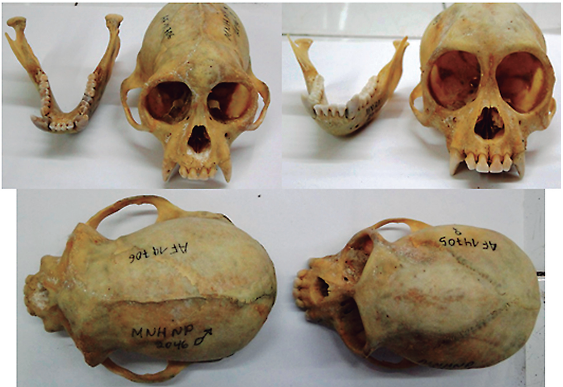
Figura 1. Cráneos de Sapajus cay de la colección del MNHNPY, macho a la izquierda y hembra a la derecha.

Las poblaciones estudiadas están separadas por el río Paraná, 17 cráneos provienen de la margen derecha del río, el resto, 23 cráneos fueron colectados en la Provincia de Misiones, Argentina, margen izquierda del Paraná (Fig. 2). Se destacan las colecciones del MACN por el buen estado de conservación de los mismos