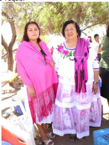
Foto 1. Pótam, mujeres Yaquis.