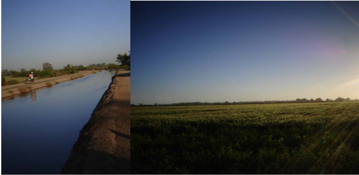
Foto 2. Pótam, canal de riego y cultivo de trigo.