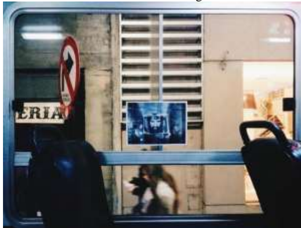
Imagen N° 2- Intervención en la ciudad de Rosario, Santa Fe. Fotografía difundida por M.A.F.I.A en su cuenta de Facebook el 31 de agosto de 2017.

Fuente: https://www.facebook.com/holamafia/photos/a.1479216235499885/1479216838833158/?type=3&permPage=1