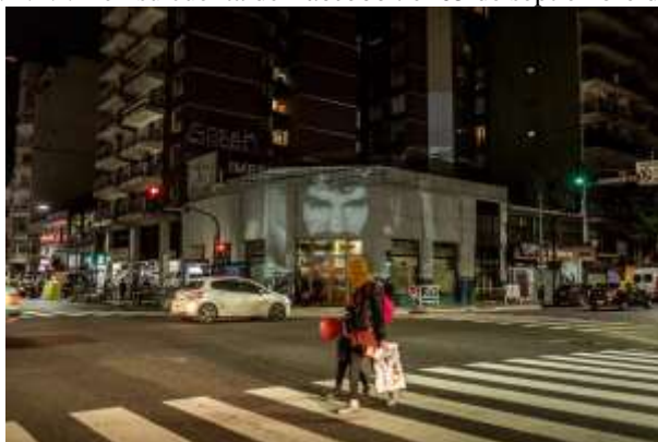
Imagen N° 3- Imagen proyectada en Almagro, Ciudad Autónoma de Buenos Aires. Fotografía difundida por M.A.F.I.A en su cuenta de Facebook el 05 de septiembre de 2017.

Fuente: https://www.facebook.com/holamafia/photos/a.1483723965049112/1483725015049007/?type=3&theater