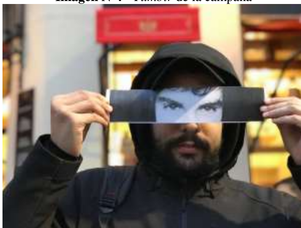
Imagen N°4 - Tumblr de la campaña