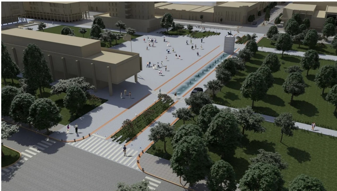
Proyección sobre la apertura de la plaza (Fuente El Periódico, 12 de diciembre de 2024) 24

Y una de las principales disputas sobre la plaza es el anuncio por parte del gobierno provincial de cortar la plaza para la circulación de vehículos, con un costo de 815 millones de pesos para “modernizar” el centro de la ciudad. La propuesta es conectar la zona norte con la zona sur, se quitaría la histórica fuente de agua, prometiendo colocar en ese lugar árboles. En dicha explanada se realizan diferentes festivales con acceso libre y gratuito, uno de ellos es “La Peatonal San Francisco” con artistas, artesanos y colectividades de gastronomía que se congregan en un festival realizado en verano, la estudiantina o el cierre del Llenate el Mate de Rock. 23 Aunque proponen poner luces rojas y verdes, para abrir y cerrar el espacio cuando haya eventos.