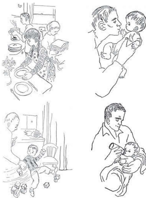
2. Collage. Matsner Gruenberg, 1956