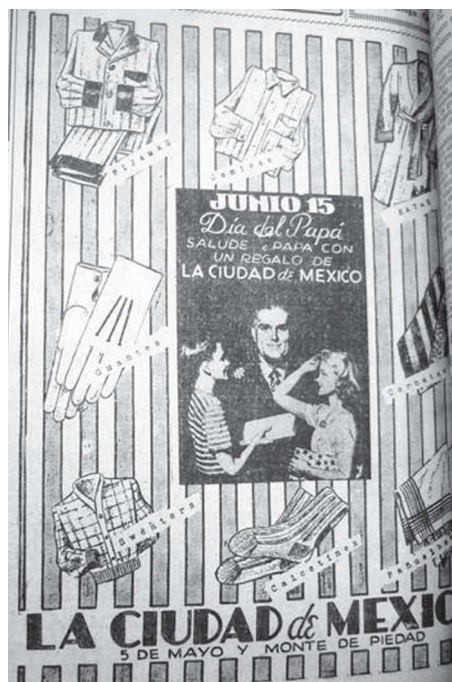
6. “Junio 15, Día del Papá”, El Universal , 10 de junio de 1942, p. 2

postura corporal que refleja alguna cercanía con su padre, pues apoya su mano izquierda sobre el hombro de su progenitor. En contraste con los anuncios publicitarios de las siguientes décadas y que analizaré más adelante, en éste se advierte, a nivel de representación, todavía cierta distancia entre padre e hijos y ninguna referencia a la relación del hombre con un ámbito doméstico.