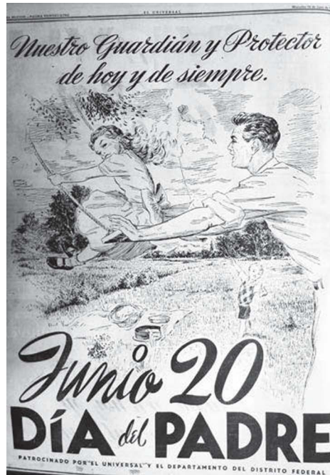
9. “Nuestro guardián y protector de hoy y siempre”, El Universal , 16 de junio de 1948, p. 24

su padre y un código de lectura parecería indicar que con esas monedas tendría que ir a comparar lo que le regalará. 69