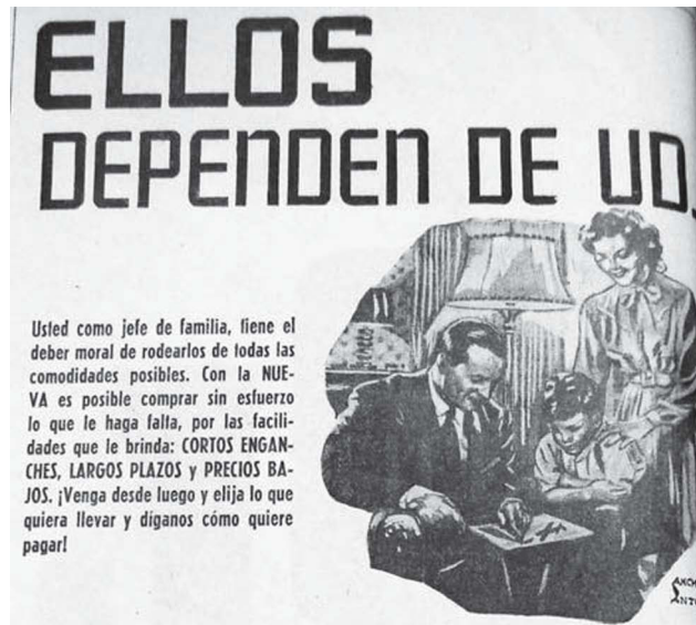
3. Detalle anuncio: "Ellos dependen de Ud.", Novedades , 3 de junio de 1947, p. 10