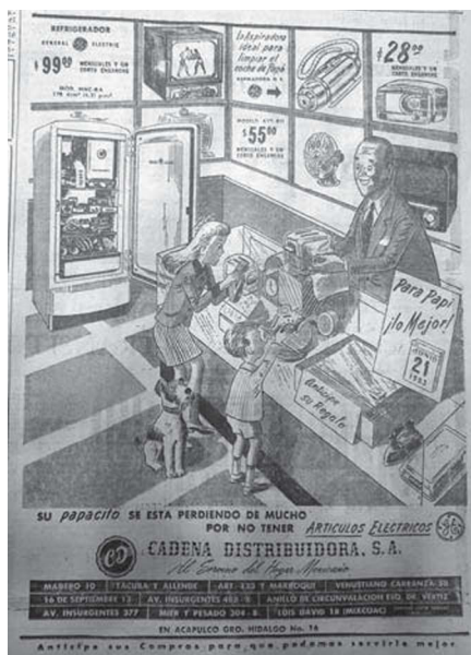
14. “Para Papi, lo mejor”, El Universal , 14 de junio de 1953, p. 9

jerárquico del padre de familia que recibía atenciones y servilismo, pero simultáneamente transgredía lo que se entendía tradicionalmente por masculinidad.