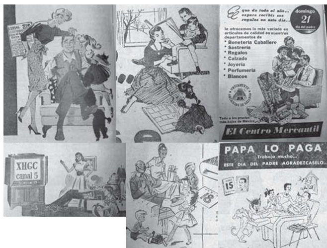
12. Detalle anuncios. El Universal , 15 de junio de 1950, p. 16; 9 de junio de 1953, p. 10; 18 de junio de 1953, p. 13; 4 de junio de 1958, p. 16; 8 de junio de 1958, p. 12; 16 junio de 1960, p. 48