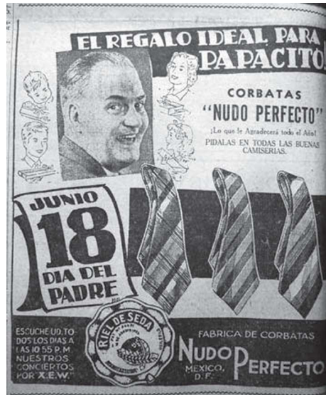
5. “El regalo ideal para papacito”, El Universal , 14 de junio de 1938, p. 4

La figura del hombre blanco, regordete, calvo sin bigote y casi en su cuarta década de vida se alejaba de ciertos ideales de atractivo masculino de la época. A su alrededor, aparecían dibujados su esposa y sus tres hijos, cada uno sosteniendo una caja envuelta para regalo. La sinergia radio-prensa se advertía en la esquina inferior izquierda del anuncio, en donde podía leerse: “escuche usted todos los días a las 10:55 p.m. nuestros conciertos por XEW”, ya que muchos programas de radio estaban financiados por empresas y gran parte de sus espacios se aprovechaban para publicidad.