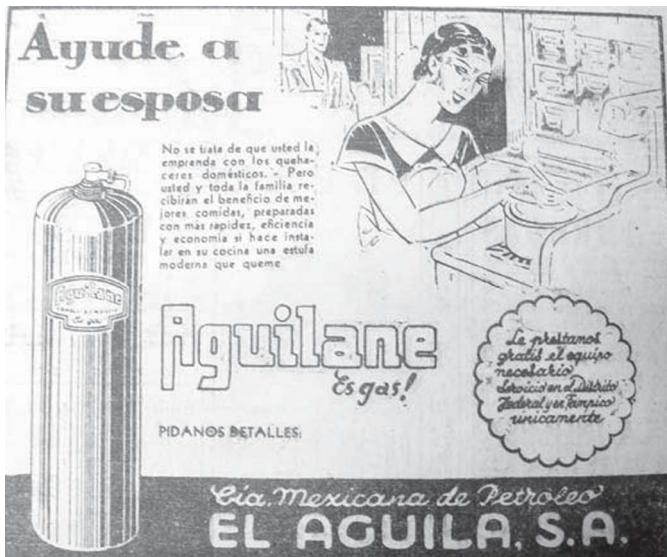
1. "Ayude a su esposa", Excélsior , 19 de julio de 1936, p. 5

la editorial Daimon, edición que probablemente fue la primera que circuló en México.