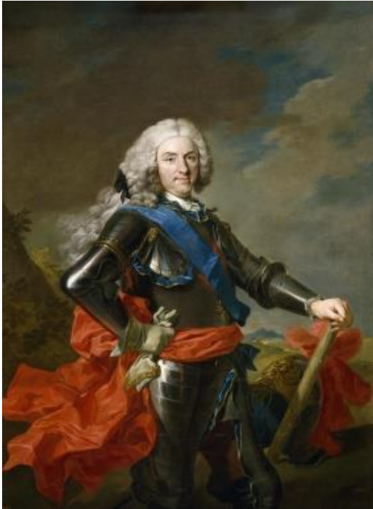
Retrato de Felipe V (1739), Louis- Michel van Loo. Museo del Prado.

27. Por la observancia que esta pragmática mira por el buen gobierno público y al multiplicar jurisdicciones, no corriendo el castigo de las penas solo por la mano de las Justicias Ordinarias, se les concede jurisdicción privativa para que puedan atender a los casos que se produzcan y puedan aplicar el castigo y ejecución de las penas al igual que se observe esto mismo en las visitas a las cárceles donde puedan moderar.