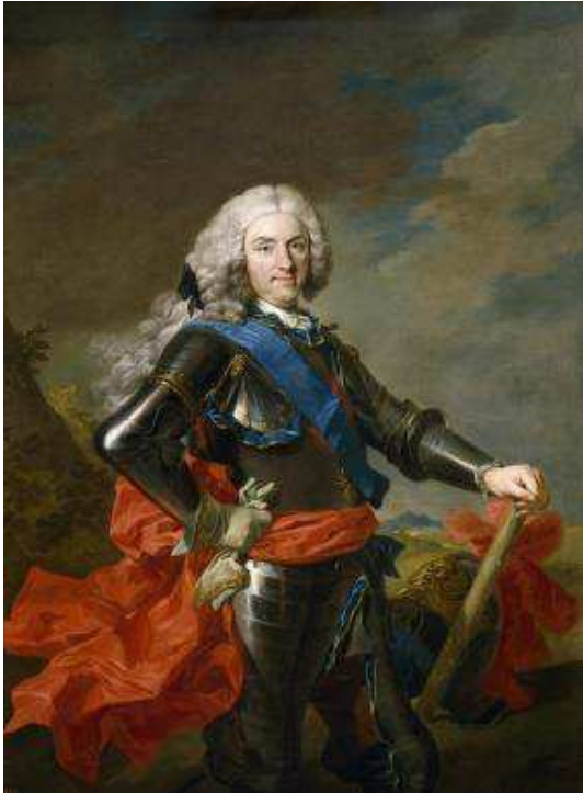
Retrato de Felipe V (1739), Louis- Michel van Loo. Museo del Prado.

27. Por la observancia que esta pragmática mira por el buen gobierno público y al multiplicar jurisdicciones, no corriendo el castigo de las penas solo por la mano de las Justicias Ordinarias, se les concede jurisdicción privativa para que puedan atender a los casos que se produzcan y puedan aplicar el castigo y ejecución de las penas al igual que se observe esto mismo en las visitas a las cárceles donde puedan moderar.