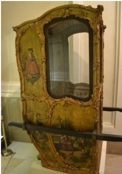
Silla de manos. Marqués de Dos Aguas.

15. Se prohíbe que excepto médicos y cirujanos, ninguna persona pueda andar en mulas de paso, sólo en caballos o rocines.