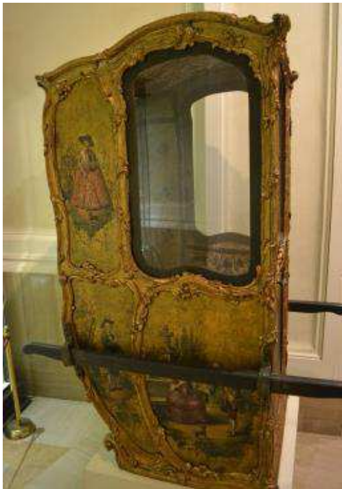
Silla de manos. Marqués de Dos Aguas.

15. Se prohíbe que excepto médicos y cirujanos, ninguna persona pueda andar en mulas de paso, sólo en caballos o rocines.