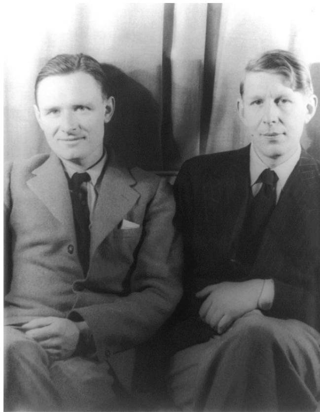
Christopher Isherwood y W.H. Auden en 1939

Peter representaría a la República de Weimar, entretenido en sus actividades decadentes – Otto- y no percibiendo la amenaza que se le viene encima. [6] Otto es el sector desencantado de baja extracción que intenta sobrevivir a base de adosarse y venderse al mejor postor, al igual que hiciese Sally Bowles y tantos otros vividores, para salir adelante en el Berlín excesivo y ambiguo.