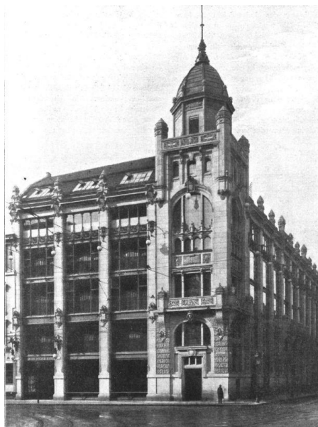
Almacenes Israel (Landauer).

Bernhard era en realidad Wilfrid Israel, según confiesa Isherwood en su libro Christopher and his kind . Israel fue un filántropo que utilizó la infraestructura de los Grandes Almacenes Israel, para procurar sacar del país al mayor número posible de judíos alemanes, financió la salida del país de parte de su plantilla de trabajadores, y gracias a sus contactos políticos en Inglaterra organizó campañas de rescate y reunificación de familias judías fuera de Alemania. El 1 de junio de 1943 el avión inglés en que viajaba Israel, junto con el actor Leslie Howard[8], fue derribado en el Golfo de Vizcaya por cazas alemanes. La propaganda nazi encubrió este hecho, como que la muerte de Israel se había debido a un ataque al corazón. De la muerte de Israel, al que Isherwood no había vuelto a ver desde su salida de Alemania, se entera en un restaurante en Praga, escuchando la conversación casual de dos hombres en la mesa de al lado.