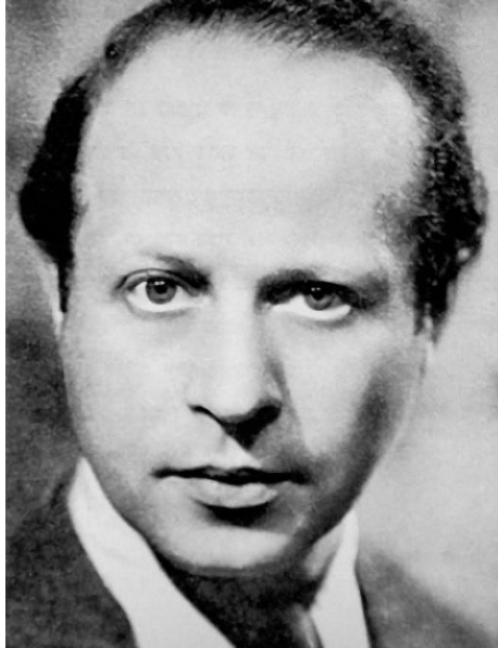
Wilfrid Israel, 1942. Ophirbaer

Bernhard era en realidad Wilfrid Israel, según confiesa Isherwood en su libro Christopher and his kind . Israel fue un filántropo que utilizó la infraestructura de los Grandes Almacenes Israel, para procurar sacar del país al mayor número posible de judíos alemanes, financió la salida del país de parte de su plantilla de trabajadores, y gracias a sus contactos políticos en Inglaterra organizó campañas de rescate y reunificación de familias judías fuera de Alemania. El 1 de junio de 1943 el avión inglés en que viajaba Israel, junto con el actor Leslie Howard[8], fue derribado en el Golfo de Vizcaya por cazas alemanes. La propaganda nazi encubrió este hecho, como que la muerte de Israel se había debido a un ataque al corazón. De la muerte de Israel, al que Isherwood no había vuelto a ver desde su salida de Alemania, se entera en un restaurante en Praga, escuchando la conversación casual de dos hombres en la mesa de al lado.