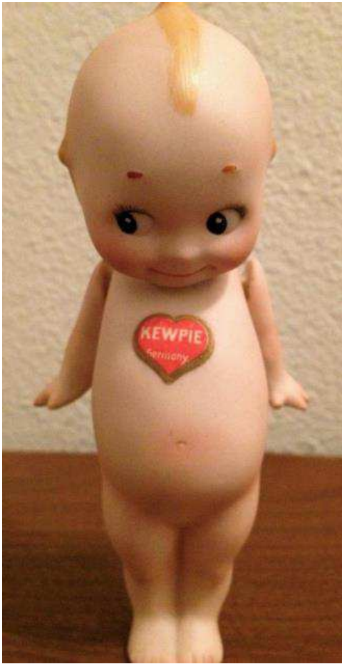
Kewpie de fabricación alemana de 1912 con el corazón en el pecho.