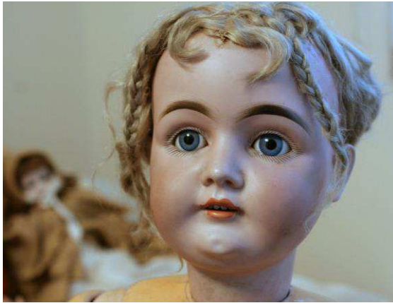
Muñeca alemana sobre 1900.

la colección de muñecas de porcelana, si el cuerpo es el auténtico o fue cambiado posteriormente.