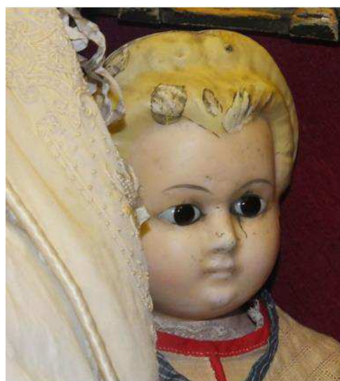
Muñeca de cera y composición de 1880 de la colección Guidhall Museum.

hombros al cuerpo de tela relleno con extremidades de cabritilla o con madera pintada. En las muñecas de cera, eran características las llamadas cabeza de “ calabaza ”, anchas y con pelo natural, y las de “ gorro ”, éstas con el pelo moldeado directamente en la propia cera.