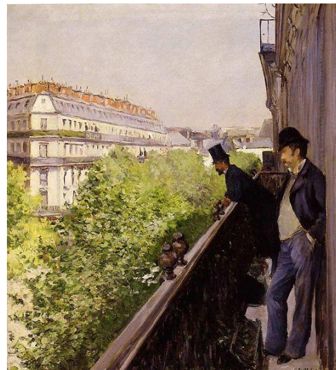
“ Un balcón, boulevard Haussmann ” de 1880.

Esta obra alude por la simple acción que representa, al calotipo “ Le Stryge ” de 1853 que Charles Nègre 253 realizó a su amigo Henri Le Secq 254 , junto a una de las gárgolas de Nôtre Dame.