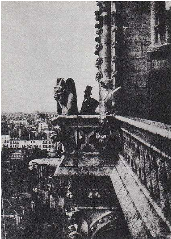
“Le Stryge” 1853 Charles Nègre.

La visión de Cailleboitte a la hora de encuadrar el tema a tratar es altamente novedoso, tanto por el momento que se centra a representar en el lienzo, como por la perspectiva desde donde realiza la toma con los pinceles. Tal es el caso de la magnífica obra “El boulevard visto desde arriba” , que remite directamente a la fotografía subjetiva de Otto Steinert 255 , “Ein-Fuß-Gänger” de 1950.