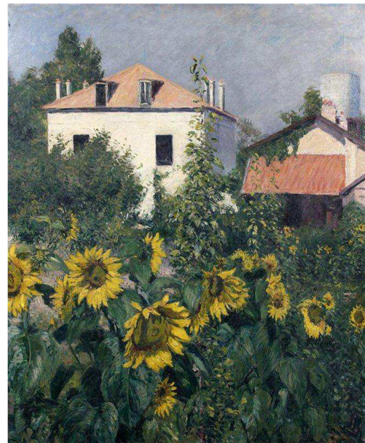
Los girasoles, jardín de Petit Gennevilliers, (1885). Colección privada.

de Boulogne en 1859, realizaron de bosques y vistas de parques parisinos. Las pinturas de la finca de Gennevilliers, son una constante recreación del mundo ajardinado que el pintor estaba construyendo como hogar. Se rodea de jardines y flores por doquier, ya sean reales o pintadas. No solo va registrando la evolución del conjunto de la naturaleza y las construcciones de la finca en los lienzos, sino que directamente decora con temática floral las estancias de la vivienda, para así hacer una inmersión en la plena naturaleza de manera verídica a la par que figurada.