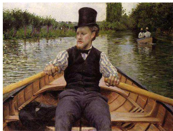
Remero con sombrero de copa 1878.

Las pinturas dedicadas a los remeros durante su estancia en Yerres, “Piraguas en el río Yerres” en 1877 o “Remero con sombrero de copa” de 1878, son un perfecto ejemplo de retrato fotográfico, centrando al remero en un enfoque lineal como si el pintor lo acompañase en su paseo en barca, utilizando una perspectiva tan realista como innovadora, como si fotografiase al remero a través del lienzo.