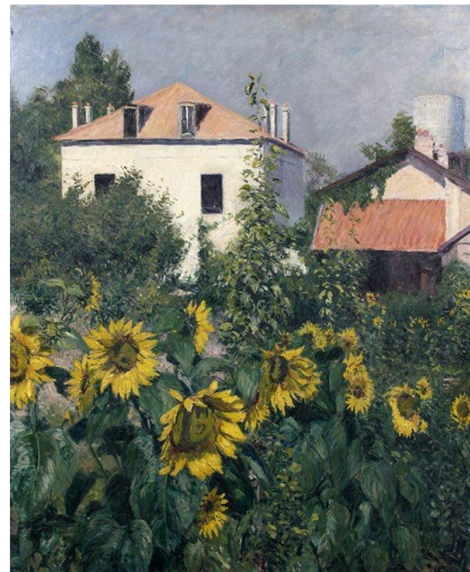
Los girasoles, jardín de Petit Gennevilliers, (1885). Colección privada.

exposiciones universales de París de 1878 y Melbourne de 1880.