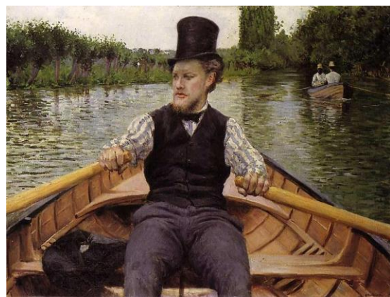
Remero con sombrero de copa 1878.

Las pinturas dedicadas a los remeros durante su estancia en Yerres, “Piraguas en el río Yerres” en 1877 o “Remero con sombrero de copa” de 1878, son un perfecto ejemplo de retrato fotográfico, centrando al remero en un enfoque lineal como si el pintor lo acompañase en su paseo en barca, utilizando una perspectiva tan realista como innovadora, como si fotografiase al remero a través del lienzo.