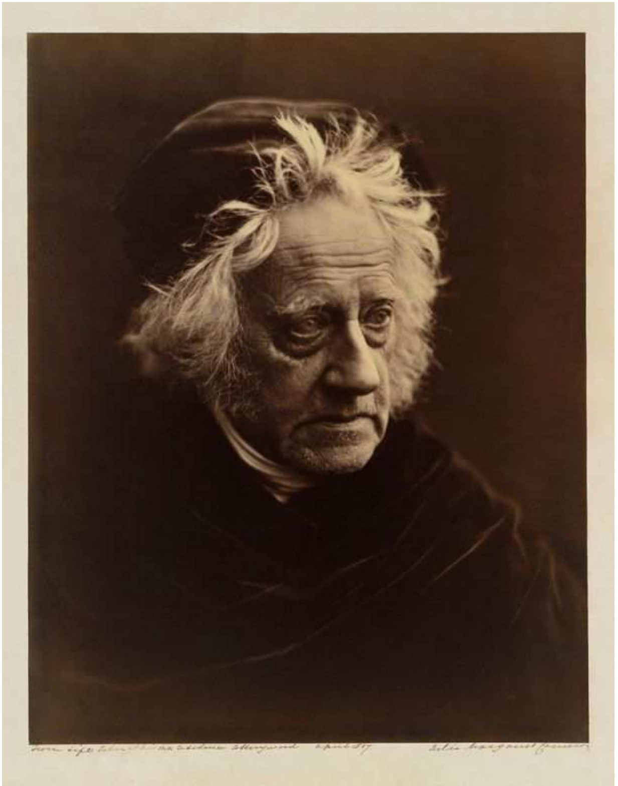
John Herschel.