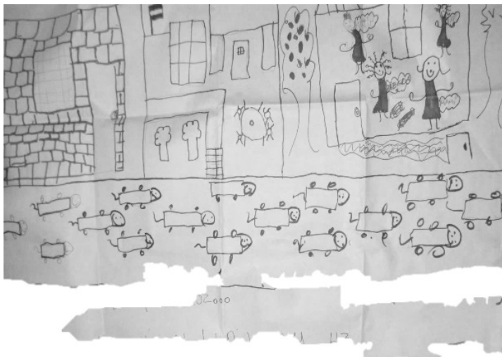
[4] Imagen 1. Gráfico sobre el barrio (Grupo Focal, elaboración colectiva)

[5] Somos los cuatro hermanos y mi papá ahora en la casa. Tenemos la pieza y la cocina. Todavía el baño, afuera. El piso ya lo va a poner (Magalí, 16 años, relato de vida).