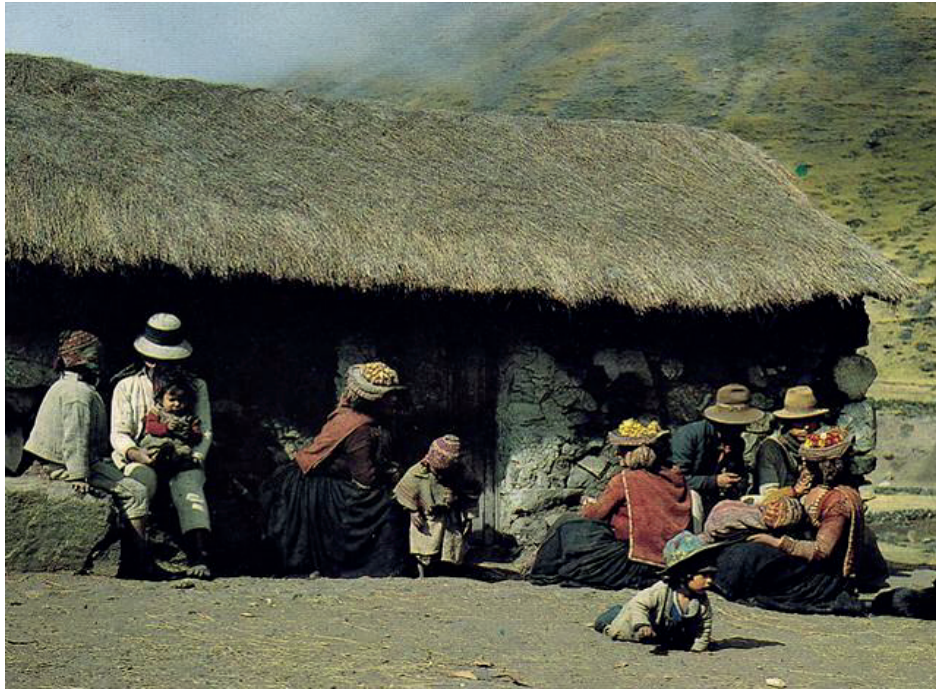
Figura 2. Ayllu Azaroma: la tierra de azachos, ganaderos y tejedores de estirpe histórico.

Desde aquí, como evidencia irrefutable de una fría realidad en tensión, sería pertinente despertar un modelo de Escuela-Montaña destinado a destruir la vitrina de los inmortales. La misma, que tenga la propiedad de reconocer los fallos y defectos del sistema con la furia de inducir e ir más allá de su radio de acción pedagógica agrupando sentimientos y emociones afectadas desde largas cordilleras continentales como los Alpes, los Himalayas y los Andes.