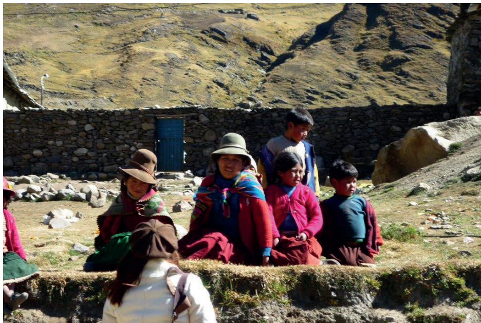
Figura 3. En las faldas de la montaña, una madre y su bebé, y cuatro niños pobladores de Quicho Azaroma.