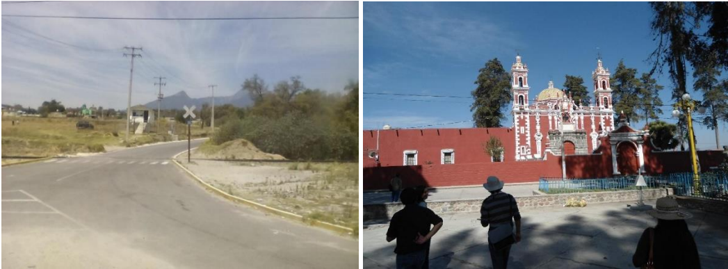
Figura 6. Vistas de San José Chiapa, Puebla. Izq.: paisaje rural hacia Municipio de San José Chiapa. Der.; Patrimonio edificado-religioso. Fotografías: AASH, 2014.