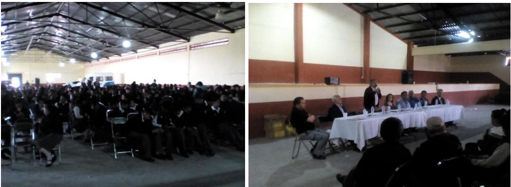
Figura 7. Presentación de los libros en San José Chiapa, Puebla. Fotografía: AASH, 2018.