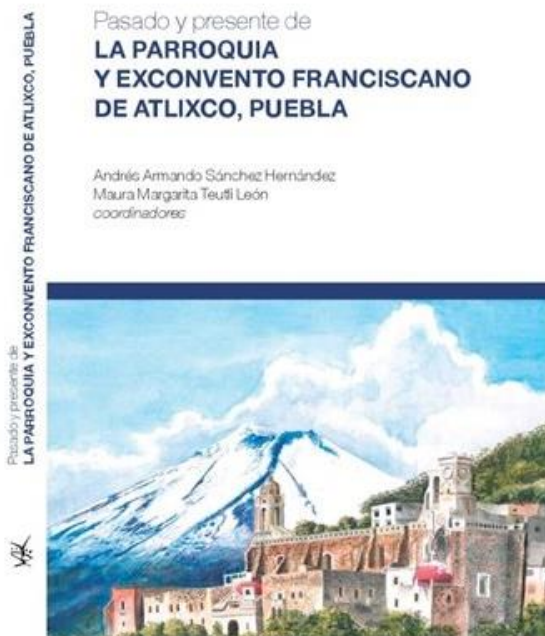
Figura 4. Portada del libro Pasado y presente de la parroquia y ex convento franciscano de Atlixco, Puebla .