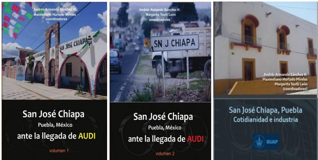
Figura 5. Portadas de los libros sobre la región de San José Chiapa, Puebla.

En estos tres libros (Figura 5) se aborda como caso de estudio San José Chiapa (Figura 6), desde diversos enfoques y disciplinas, como la ingeniería química para conocer las condiciones de la calidad del agua; las condiciones territoriales desde la geografía y los estudios sobre la ciudad; la aproximación social desde la antropología y sociología; y la idea de lo “valioso” desde la perspectiva de lo edificado y cultural, así como lo natural, desde los estudios patrimoniales. El acercamiento al Municipio a través de sus autoridades culminando con la presentación y obsequio de varios libros a los estudiantes de diversos niveles permitió dar a conocer la producción así como motivar a los alumnos y a la población interesada a conocer su región (Figura 7). Uno de los argumentos trabajados en la investigación permitieron hacer un balance de las condiciones ante la llegada de la empresa automotriz AUDI, aportando un estado de la cuestión de la región rural que da cuenta de severos efectos en lo social, lo económico (alza de precios y baja capacidad de adquisición), etcétera. Efectos que han dejado ver la marginación en las zonas aledañas, y la segregación en las zonas de la empresa, además, han causado problemas para los habitantes en cuanto han aumentado los costos de los terrenos para construir.