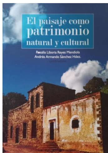
Figura 2. Portada de libro El paisaje como patrimonio natural y cultural .

Los trabajos de este libro abordan temas como la producción agrícola, la flora y la fauna, así como los problemas del agua y sus condiciones químicas. Además, se puede ver un repaso por los aspectos del patrimonio natural como los espacios verdes en las cercanías de los río y cultural inmerso en edificios o infraestructura como puentes, acueductos, templos, etcétera, de una región rural con panoramas o paisajes como conductor de la investigación, con insoslayables estudios interdisciplinarios.