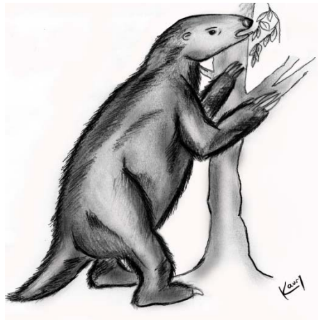
Ilustración por Karem Gamarra.

Este género fue creado por el paleontólogo Richard Owen en 1839 gracias a los restos hallados por Charles Darwin en Punta Alta, un paraje cercano a Bahía Blanca. Se correspondía con mamíferos de gran tamaño que llegaron a medir cuatro metros de longitud y 1,5 metros de alto. Se encuentran emparentados con los actuales perezosos y osos hormigueros, y formaron parte de un grupo conocido como perezosos terrestres gigantes o gravígrados (nombre que obedece a la descripción de sus movimientos lentos o pesados). A pesar de su gran tamaño y de calcularse que habrían pesado entre 800 kilos y una tonelada, se los asocia a cuevas subterráneas de casi dos metros de diámetro. Dentro de estas se han encontrado trazas realizadas por sus uñas, coincidentemente con la robusta estructura ósea que compone sus miembros delanteros y sus manos en forma de pala con dos de los cinco dedos terminados en garras, ambas características que les permitirían cavar este tipo de túneles.