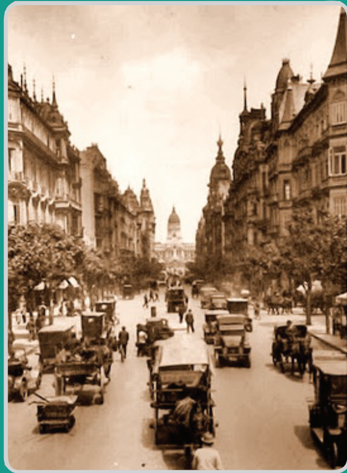
AV. DE MAYO, BUENOS AIRES 1920