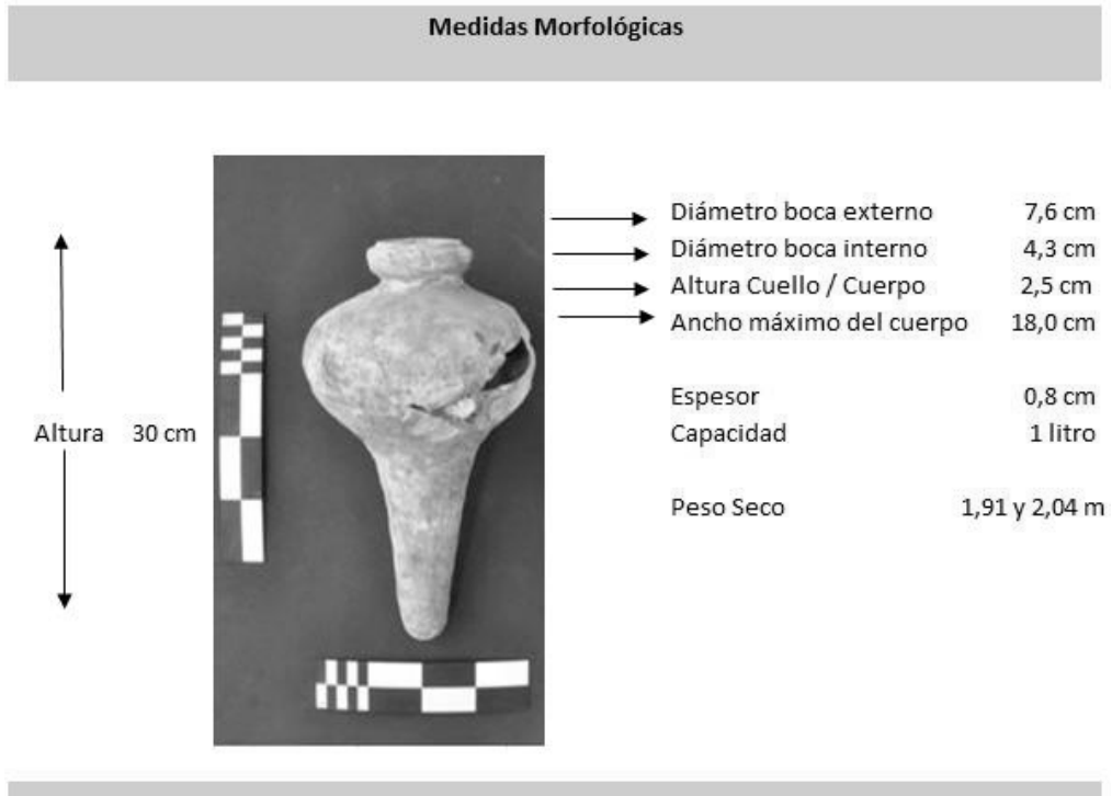
Figura 1. Medidas morfológicas de las botijas